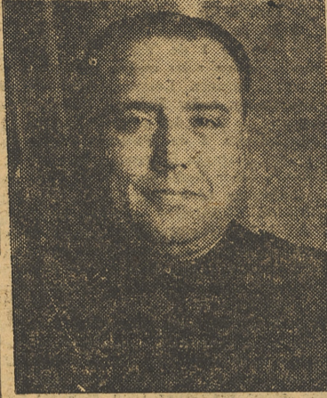
DON EDUARDO AUNÓS, MINISTRO DE JUSTICIA

Tales convenios no sólo representan la solución al problema capital de esta feracísima región valenciana, sino que alcanzan dimensión nacional, por el carácter social que para nuestros productores tiene, y por el volumen también del comercio y beneficios. El anuncio de nuevos contratos con otros países europeos, que vayan a completar el cuadro de nuestra exportación agrícola, termina de presentarnos a nuestra Organización Sindical como una fuerza capaz de dar contenido entero al Poder, en servicio siempre de los intereses en mayor grado vitales de nuestra economía, y pensando siempre en que sólo una España económicamente fuerte hará de nuestra patria lo que hasta ahora no ha sido.