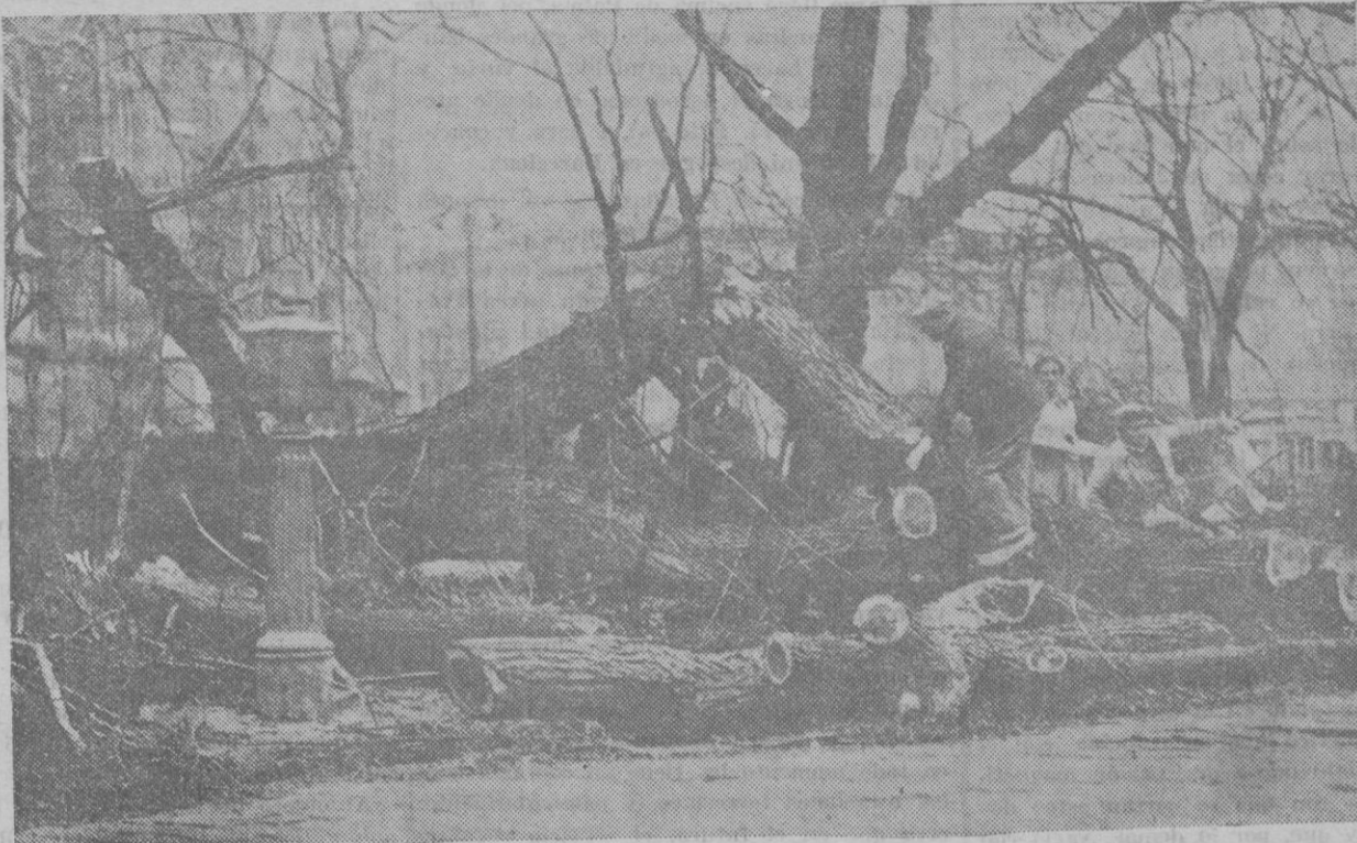
El vendaval ha causado grandes daños en muchas regiones. — Véase un parque de Burdeos, cuyos árboles fueron tronchados por el huracán