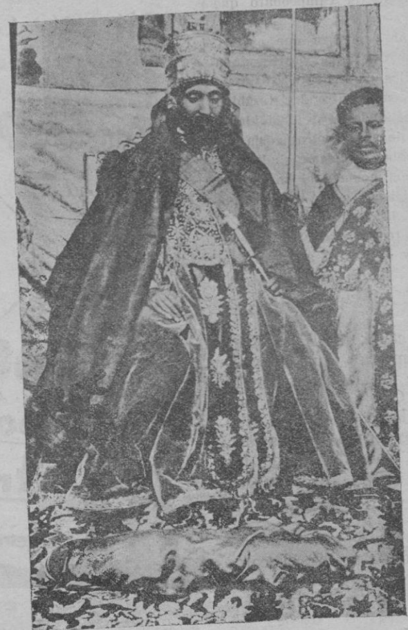
El Rey de Abisinia Haile Selassie, que tiene pendiente con Italia un grave conflicto

de Agricultura?: Que si seguían las cosas así, cuando a los labradores les fueran a cobrar la contribución, se iban a ver obligados a pagar con trigo. —Eso se lo dice Su Señoría al Ministro de Hacienda, y yo creo que él resolverá el problema — le contestó el Ministro de Agricultura al ilustre Diputado, que por dos veces ha dado lo que se llama "el clavo" con una oportunidad magnífica. Porque el caso, en efecto, es así: Si el labrador no tiene dinero, cuando el Estado vaya a cobrarle contribuciones, lo menos que debe hacer, es pagar con trigo. ¡Ah! Y a precio de tasa, porque si el Gobierno tiene una Ley de tasas, él es el primero que tiene que cumplir esa Ley. Y si a mí me vienen a cobrar y no tengo, pongo trigo a disposición del Estado. Si a mí me fueran a embargar por no pagar la contribución de unas tierras, me embargarían también trigo y nada más que trigo. ¡Y siempre a precio de tasa! Es lamentable que haya que llegar a estos extremos, que en la ciudad no comprenderán muchos; pero que en la vida rural española resulta de una naturalidad extraordinaria. El hombre que se ha pasado el año trabajando su tierra, dejando su esfuerzo diario desde que la prepara para sembrar hasta que siega y hace las faenas de era, con todo el intermedio de contrariedades; si say sequía, clamando al cielo unas gotas de agua; si hiela, o hay tormentas, o se encena el suelo, pidiendo unos rayos de sol; siempre pendiente de todo,