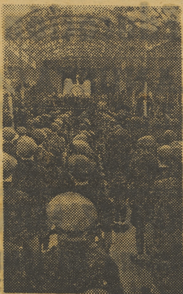
Vista del acto del r. de J. ayer en los viveros

En la mañana de ayer se celebraron los actos que, con motivo de la bendición y entrega de tres banderines, organizó la Delegación Provincial del F. J.