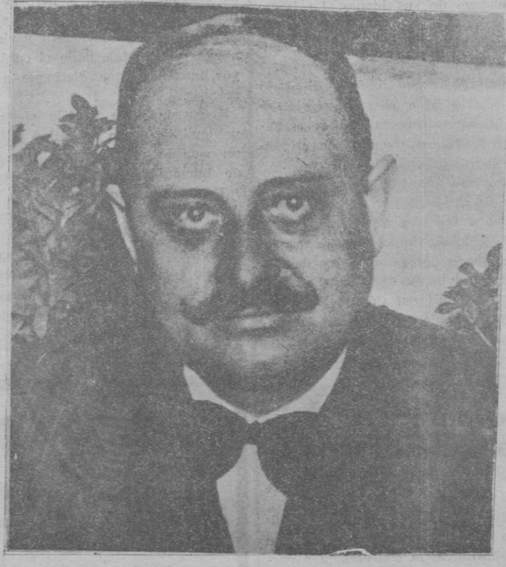
Don Gerardo Abad Conde, nuevo ministro de Marina

cedieran autorización para dirigir el procedimiento contra él. Cuando la responsabilidad recayere sobre editores o impresores, los Tribunales podrán substituir la pena personal por una multa de quinientas a cincuenta mil pesetas, que fijarán atendiendo a la naturaleza del delito, tirada del periódico y publicidad del mismo. Los propietarios de periódicos serán civilmente responsables en caso de insolvencia de los que lo sean criminalmente. Cuando hayan recaído anteriormente dos