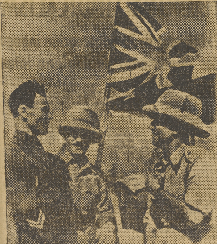
Telefotografía del encuentro y conferencia de los altos mandos soviético e inglés en los días de la ocupación

En el aspecto urbano, preside un núcleo de edificios y una red de calles de muy estimable sabor. Con su proximidad al palacio de Dos Aguas, se completa un primoroso acorde arquitectónico. Dicha zona está afectada por algunas reformas, que es de esperar se realicen subordinándolas al espíritu artístico e histórico de aquellos edificios.