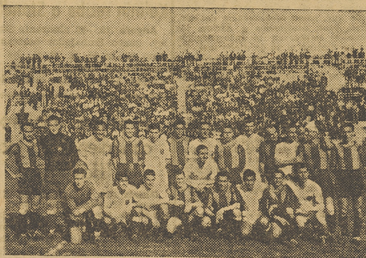
Los equipos antes del encuentro