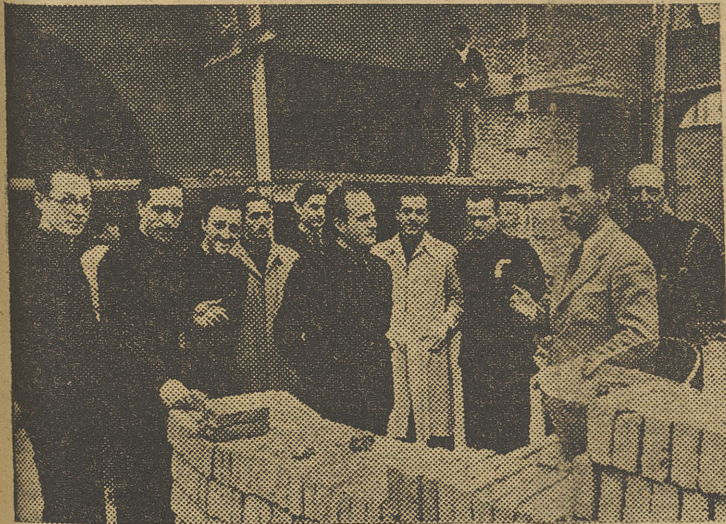
Los Delegados de Distrito de la Falange valenciana han visitado esta mañana las obras de construcción de nuestra Feria Internacional de Muestras. (INFORMACION EN SEGUNDA PLANA).