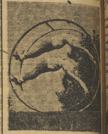
Un conjunto natural de juventud, agilidad y belleza