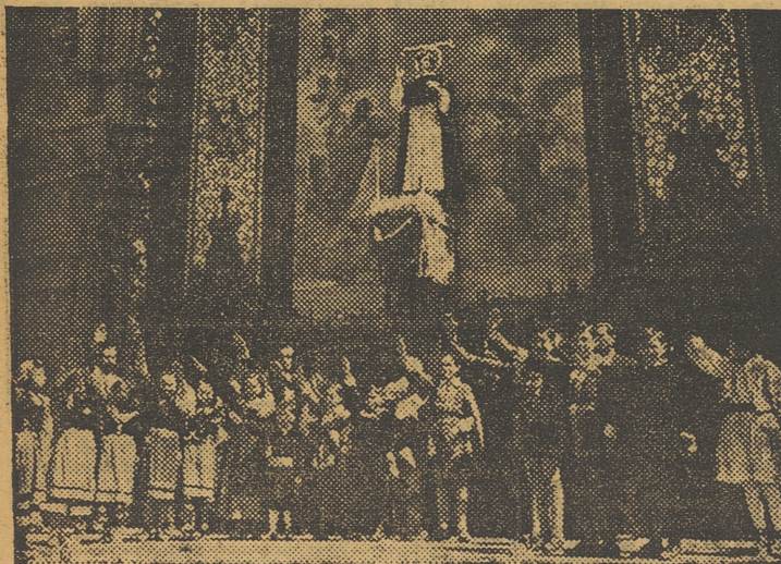
Mientras el público les dedica sus aplausos, los niños que han intervenido en una de las representaciones de «Miracres», saludan brazo en alto. — (Foto Finezas).