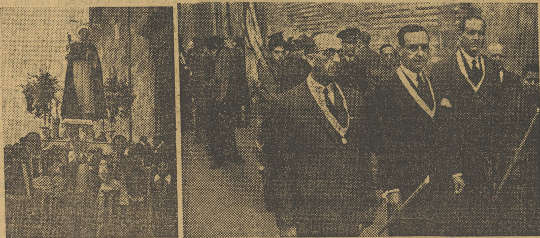
Imagen de San Vicente Ferrer, que ayer fué trasladada procesionalmente a su altar de la Plaza de la Virgen. — El Alcalde preside la procesion que salió ayer de la Iglesia de San Esteban. — (Fotos Finezas). (INFORMACION EN SEGUNDA PAGINA)