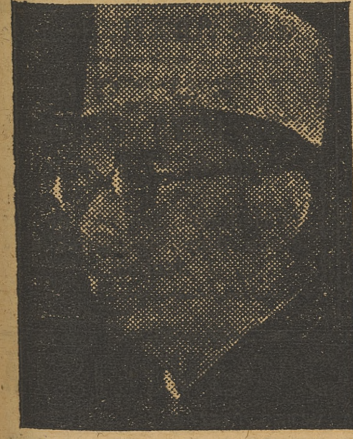
Subhas Chandra Bose

za la colonia, etc., son los más inquietos. Los hindúes quisieron aprovecharse —como también los birmanos— del principio expuesto en el artículo tercero de la «Declaración del Atlántico», en el cual prometían respetar el derecho de todos los pueblos a escoger su forma de Gobierno y devolver los derechos que no quisieran entrar en esta constitución, formarían otro Estado aparte, también con estatuto de Dominio. Los dos primeros puntos casi satisfacen dos de los más ardientes deseos de los nacionalistas y puestos como condición para llegar a un acuerdo: «Derecho a la independencia, inmediata e incondicionada, y Gobierno nacional, aunque sea interino.» Si ha cambiado de opinión, no es por convencimiento, sino obligado por las circunstancias. La guerra que aproxima a la India y es preciso asegurarse a los indígenas. Y más que nada, le ha formado a ello Stafford Cripps, la nueva estrella política inglesa.