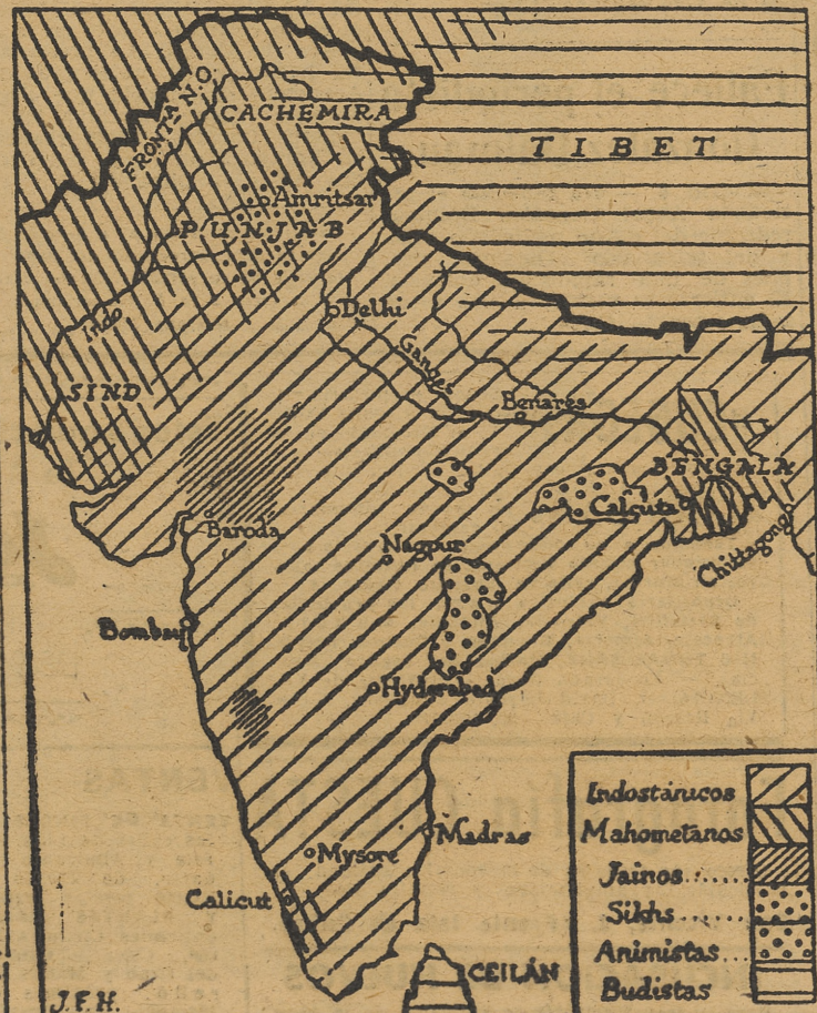
Mapa de la distribución de las religiones en la India