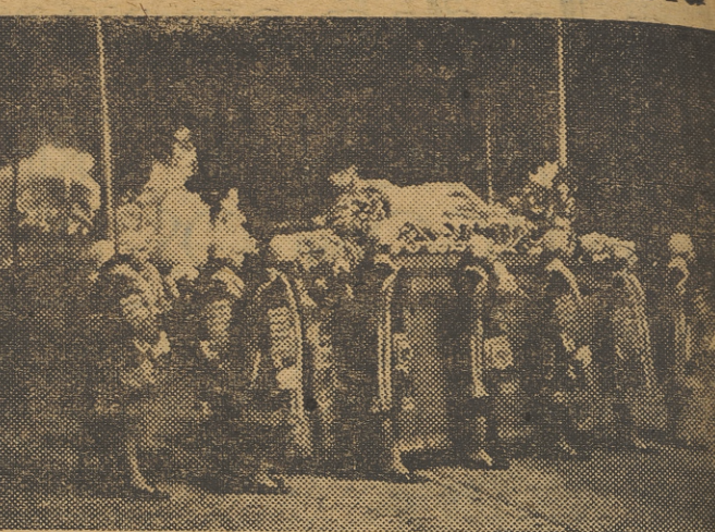
Uno de los pasos de la procesión del Silencio, organizada por los Cruzados de la Fe. — (Foto Cifra).