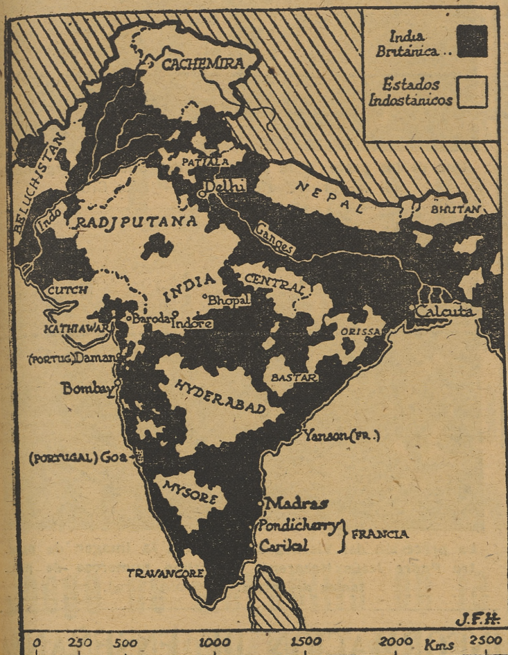
Mapa de los principales Estados independientes de la India