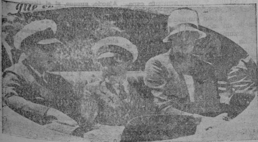
El ex-Infante D. Gonzalo, fotografía obtenida con su hermano el ex-Infante D. Juan

Durante su estancia en la citada capital belga se hospedaba en la residencia de un abate, donde permanecía toda la semana, a excepción de los domingos, que acudía a almorzar con el marqués de Foronda, que también pasa largas temporadas en Lovai- na. Esto complacía extraordinariamente a don Gonzalo, que manifestó en repetidas ocasiones su satisfacción por el trato reci-