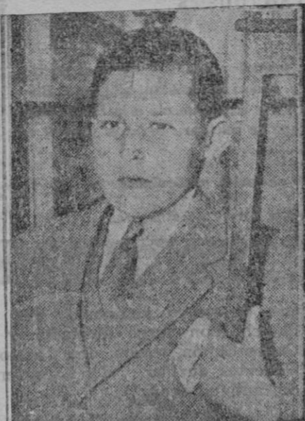
El ex-Infante D. Gonzalo que ha muerto víctima de un accidente au- tomovilista

bido de parte del mencionado aristócrata es- pañol.