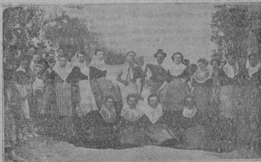
Payesas de Lloret ed Vista Alegre que se distinguieron en el típico baile de de boleros