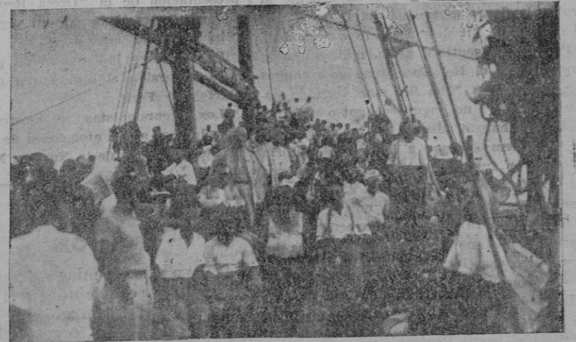
Aspecto que ofrecía la cubierta del velero "Cala Mondragó" durante la excursión al "Torrent de Pareys".