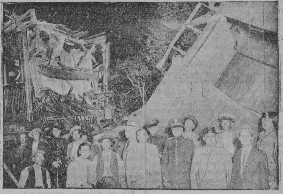
De la catástrofe ferroviaria en San Baudilio. — El coche furgón y el coche de pasajeros donde hubo el mayor número de víctimas

Los visitantes fueron obsequiados por el expresado comandante con varios refrescos, poniendo a su disposición una canoa del buque al objeto de trasladarse a bordo del «Lazaga».