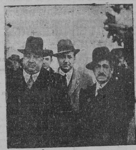
Los ministros Sres. Salazar Alonso y Cid que estuvieron en Sevilla para presenciar las cofradías del Jueves Santo. —El primero por su enérgica actuación que permitió la celebración de las procesiones ha sido objeto de constantes homenajes