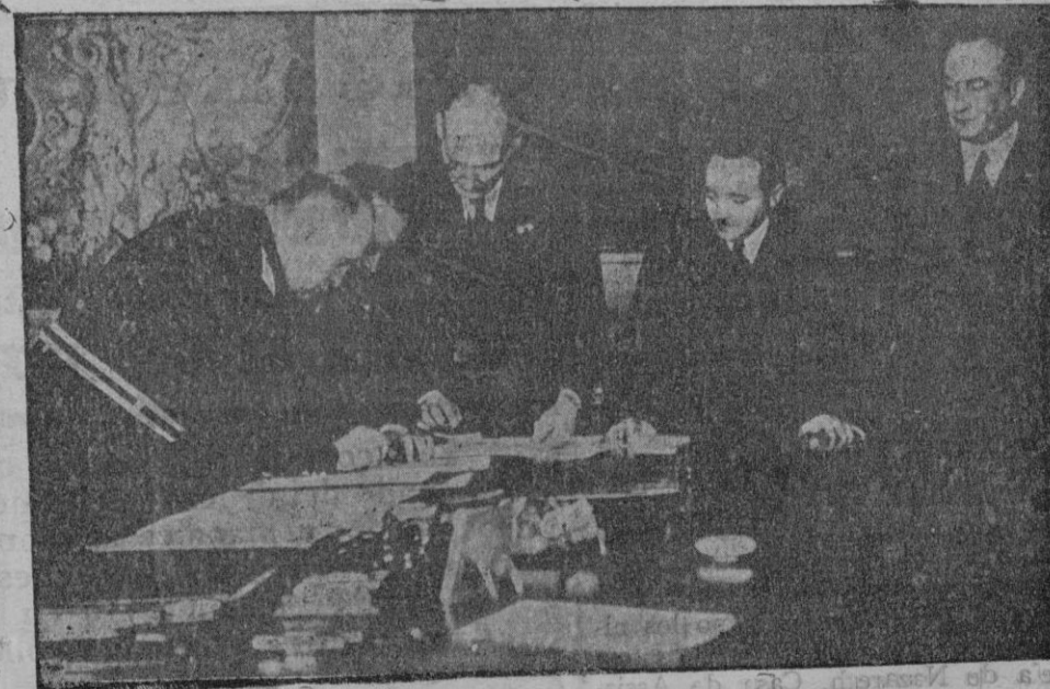
El pacto de Roma.—Sobre la mesa de trabajo del Duce, han sido firmados los protocolos resultantes de la Conferencia de los Tres. En la foto aparece Mussolini estampando su firma en los documentos. Gombos, primer ministro de Hungría, aparece a la derecha del canceller Dollfuss