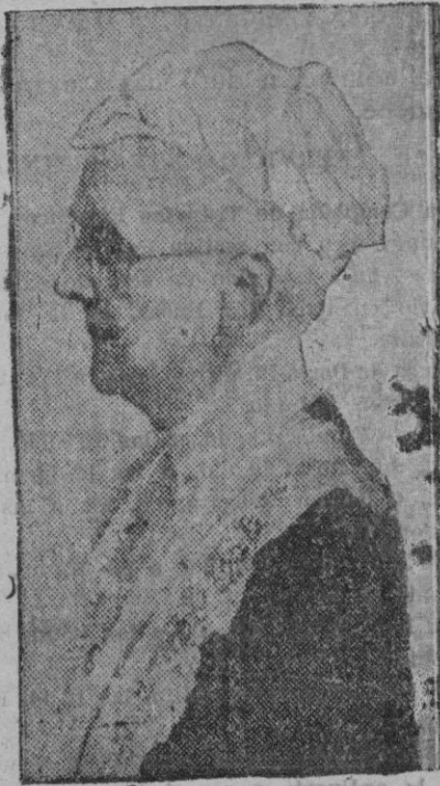
La reina madre de Holanda, Emma Adelaida Guillermina que acaba de fallecer a los 76 años de edad