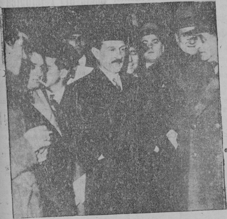
M. Chautemps, que acaba de formar gobierno

Nos manifestó ayer el señor Gobernador, que ayer por la mañana se habían reintegrado al trabajo los obreros de la fábrica «Fundición Mallor-