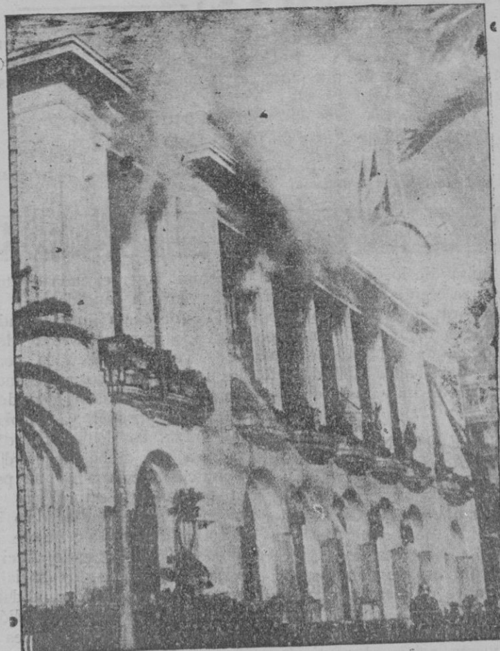
Niza.—Un voraz incendio destruye el Palacio del Mediterráneo. El palacio en llamas

—De ningún modo. Los elementos de derecha del partido socialista, Prieto, Besteiro, Saborit, etc., seguirán afiliados a la Segunda Internacional. Muchos elementos republicanos que no se habían hecho socialistas por parecerles excesiva la tendencia revolucionaria de dicho partido, se inscribirán ahora. Es casi seguro que se formará un partido socialista pequeño-burgués, parecido al de Francia, un partido más socialdemócrata que socialista, del tipo de los que hoy están dentro de la Segunda