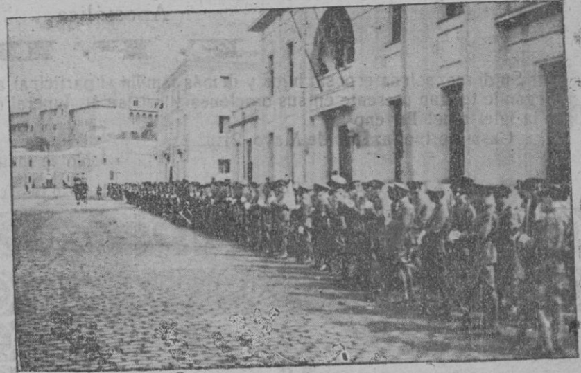
El día del Ejército en Palma.—La Infantería formada a lo largo del paseo del Muelle

Se han conocido algunos detalles de los términos en que se desarrolló la entrevista de los Sres. Azaña y Domingo con el Sr. Lerroux. El jefe radical se hallaba en cama cuando llegaron a su hotel, en unión del Sr. Martínez Barrios, los señores Domingo y Azaña. Los tres personajes penetraron hasta la alcoba del Sr. Lerroux. Este, al ver al Sr. Azaña, le dijo: —Agradezco a usted infinitamente esta visita. Reconozco noblemente que yo no hubiera hecho lo mismo. No hubiera ido a visitar a usted. —Pues yo sí—replicó el señor Azaña—. Por la República no he vacilado en hacerlo. La conversación se desliza a partir de este punto en términos de gran afecto y cordialidad, y los visitantes encontraron en el Sr. Lerroux una excelente disposición de ánimo para salvar las dificultades.