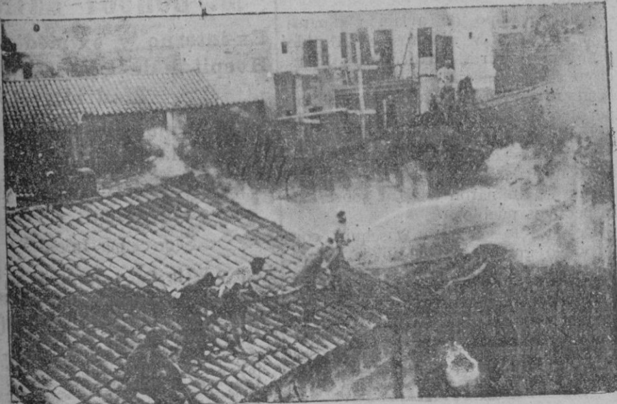
El incendio de la fundición Calafell

En este sentido, terminó diciendo, solicitado que dictéis el veredicto.