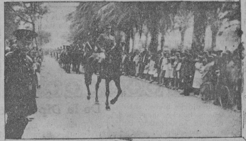
El día del Ejército en Palma.—El desfile por el paseo de Sagrera