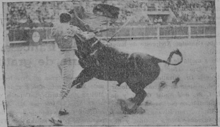
Solórzano en un pase de muleta