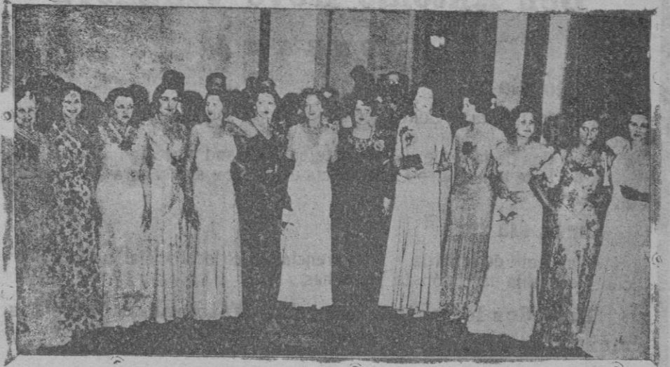
Las bellezas europeas aspirantes al título de "Miss Europa" en el gran Certamen que se celebrará en Madrid el próximo día 27. He aquí, de izquierda a derecha: "Miss Dinamarca", "Miss Inglaterra", "Miss Francia", "Miss Bélgica", "Miss Yugoslavia", "Miss Italia", "Miss Alemania", "Miss Rusia", "Miss Escocia", "Miss Noruega", "Miss Rumania", "Miss Hungría" y "Miss Suecia".—Falta "Miss España", ya conocida

De todo ello se ha dado cuenta al Juzgado, continuando las fuerzas gestiones para averiguar el paradero