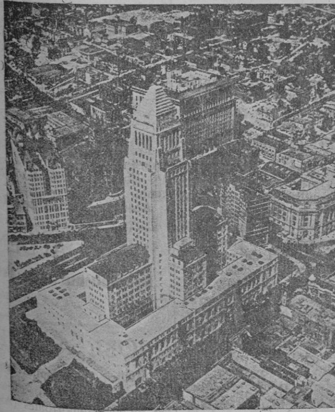
La ciudad de Los Angeles una de las más afectadas por el terremoto que ha azotado las tierras de California

No es hora de destruir, sino de construir activa y urgentemente. Y la esencia misma del fascismo es construir. Harold E. Goad (cuyo importantísimo libro "El Estado corporativo" acaba de traducir al castellano el marqués de la Eliseda, a quien por ello habremos de deber gratitud), lo define así: "Empleando una palabra biológica podríamos decir que es (el fascismo) el más anabólico de los credos políticos. Conserva todo material aprovechable por pequeño que sea, lo absorbe, lo asimila y con él construye, después de desechar tan solo todo lo débil, enfermo o capaz de traicionar su consis-