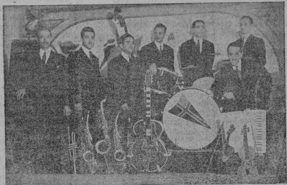
La aplaudida orquesta MARIMBA, titular del Club Náutico de Palma, que en las próximas Verbenas de San Agustín actuará en el Parque Municipal de La Torre