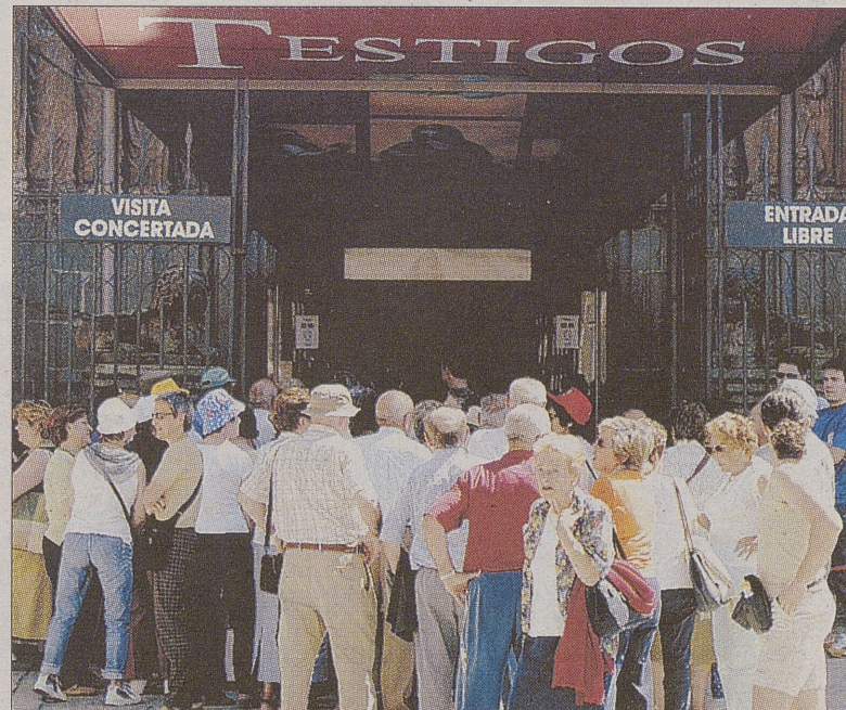
Puerta de entrada a la exposición 'Testigos', de Las Edades del Hombre.

Sánchez ha afirmado también que la exposición está siendo un éxito en todos los aspectos y que se ha producido un gran dinamismo económico y cultural, además de generar un movimiento empresarial que perdurara.