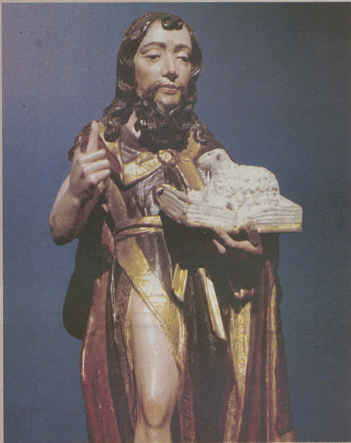
'San Juan Bautista' se puede observar en el Capítulo V de 'Testigos'. / RAÚL SANCHIDRIÁN

personas visitaron 'Testigos' durante las dieciocho primeras semanas