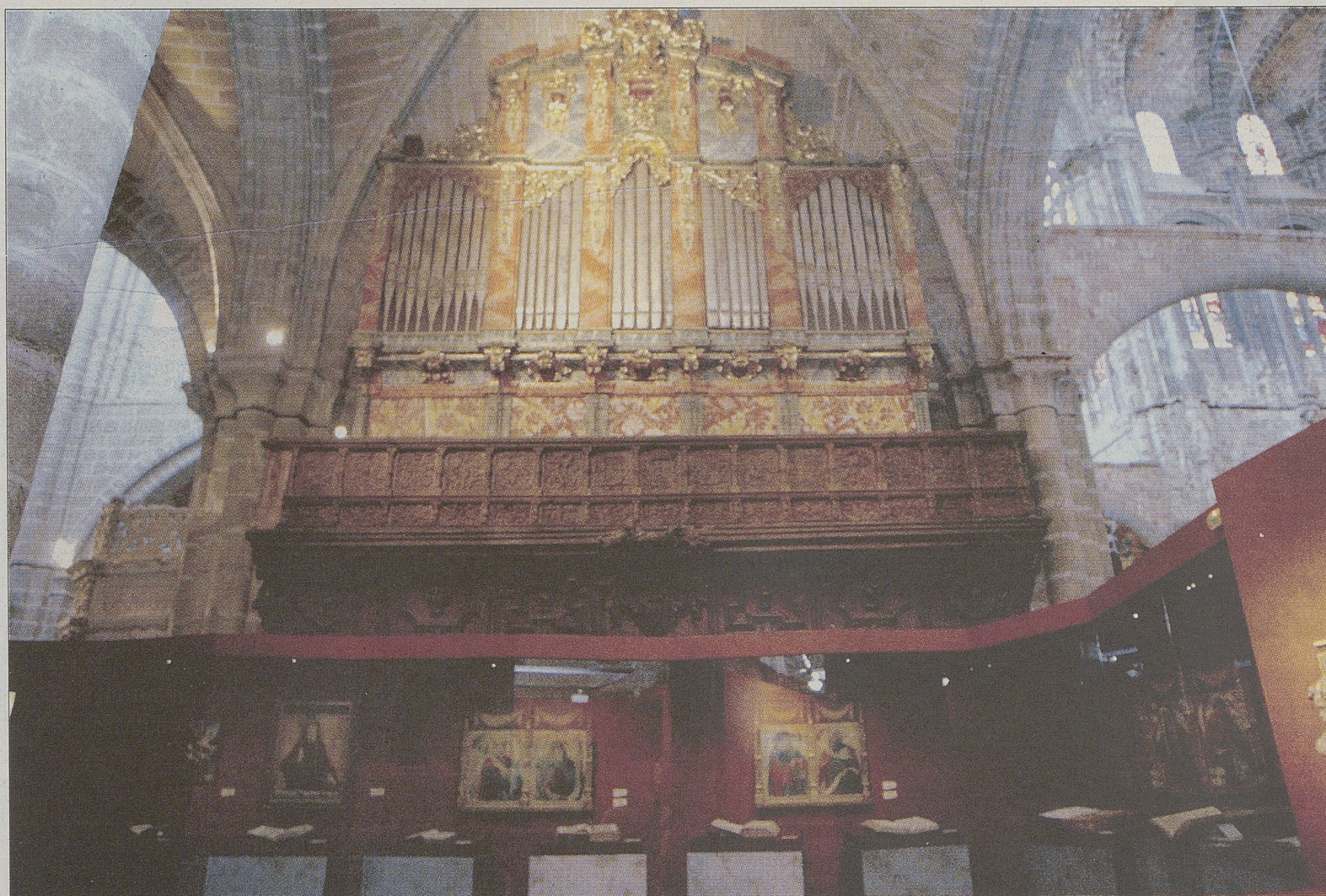
Vista del órgano de la Catedral de Ávila, flanqueado por varias de las piezas que integran la exposición 'Testigos'.

Plaza de Nalvillos, 3. Horarios: de 10,00 a 14,00 y de 17,00 a 20,00 horas. Entrada: 1,20 euros. La visita se complementa con el almacén visitable, en la vecina iglesia de Santo Tomé el Viejo (Plaza de Italia).