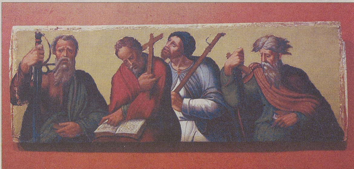
Tablas del Apostolado, del retablo de la iglesia de San Pascual. / RAÚL SANCHIDRIÁN