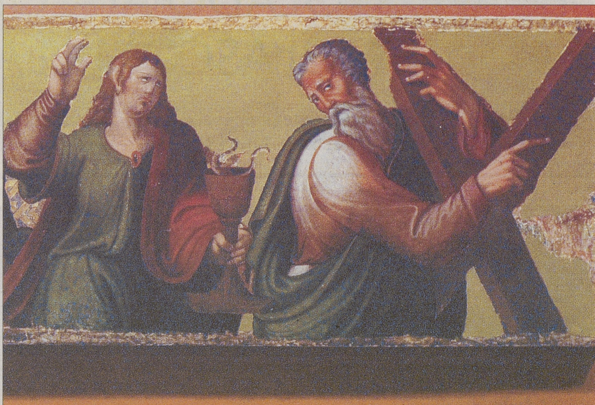
Detalle de San Juan con la copa ponzoñosa y San Andrés con la cruz en forma de aspa de su martirio. / RAÚL SANCHIDRIÁN