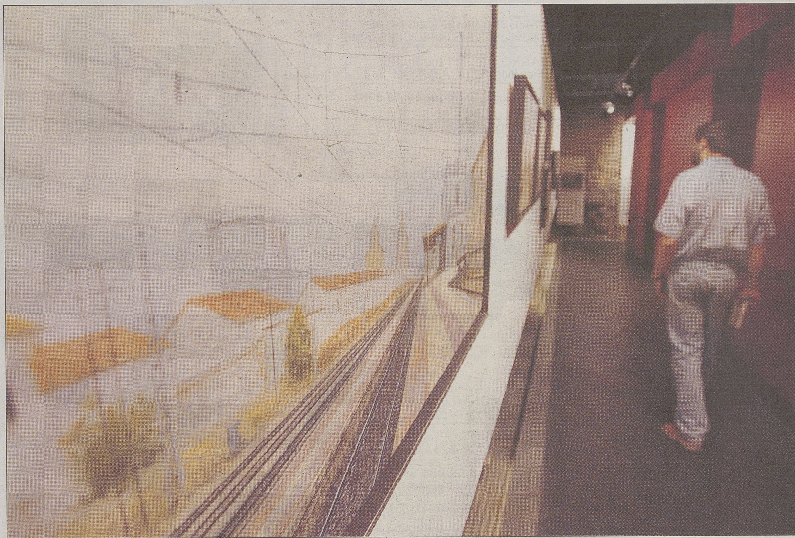
Un visitante de la exposición observa uno de los cuadros que forman parte de la muestra de Ricardo Sánchez.