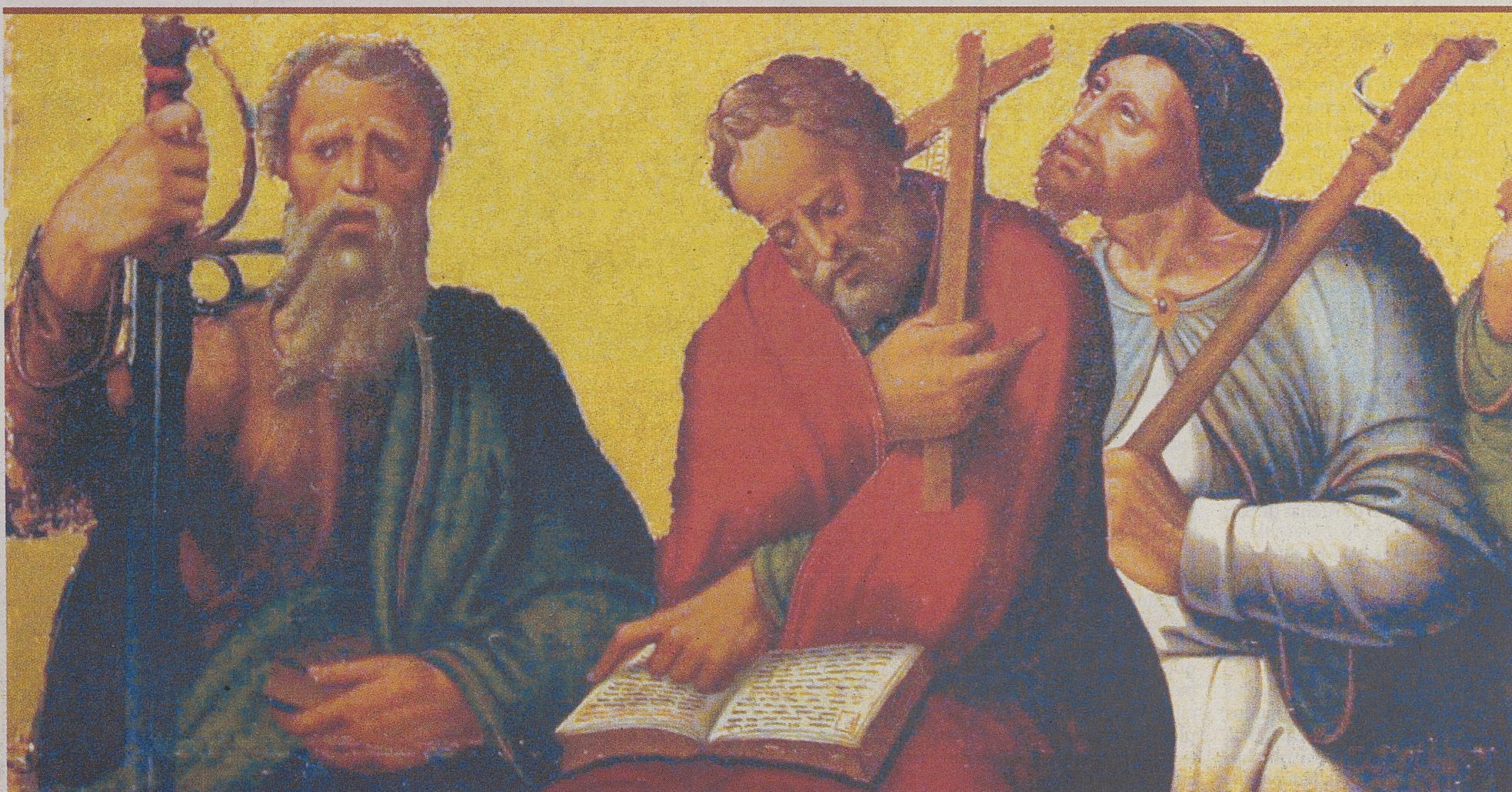
Una de las tres tablas del Apostolado procedentes de la iglesia de San Millán de Blascomillán. / RAÚL SANCHIDRIÁN

Más de 434.343 personas visitaron 'Testigos' durante las diecisiete primeras semanas