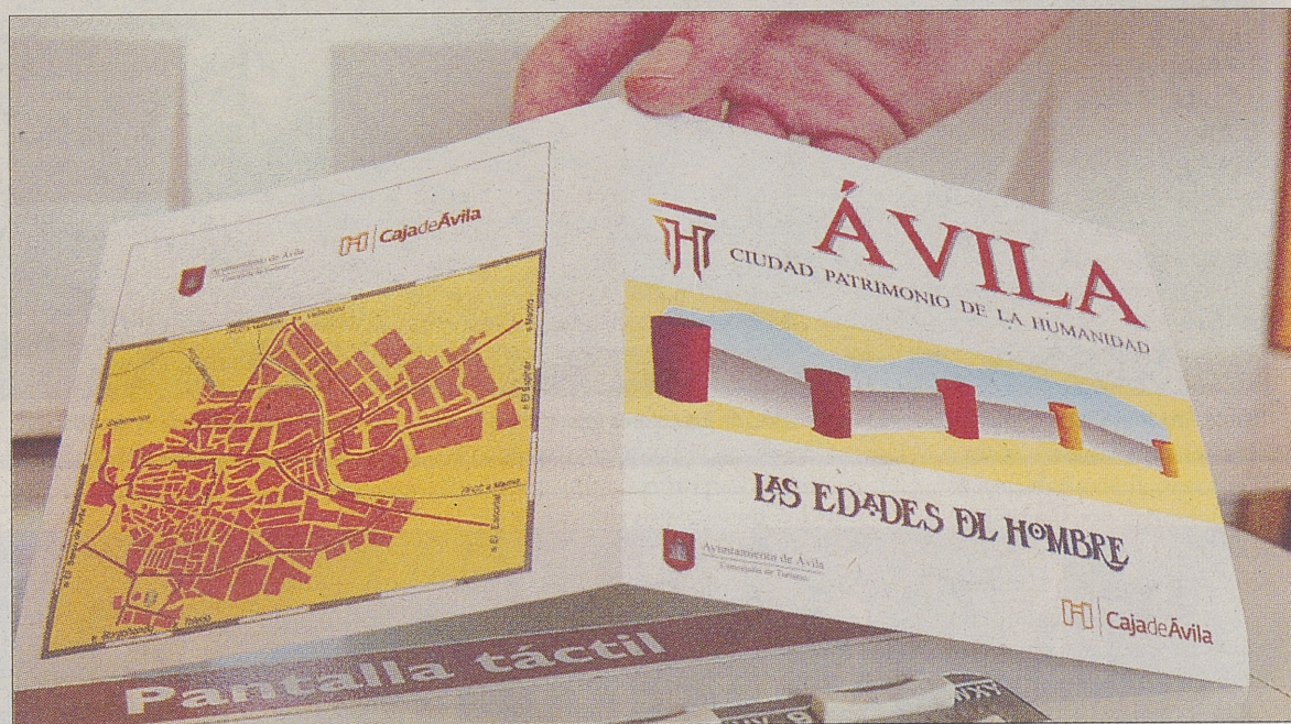
El callejero incluye la situación de los monumentos más importantes de la ciudad. / ANTONIO BARTOLOMÉ

De estos mapas manejables, se han editado un total de 200.000 ejemplares de los que aproximadamente la mitad han ido a parar a manos del Ayuntamiento de Ávila. «Se ha distribuido ya una parte en el Centro de Recepción de Visitantes, en los parking habilitados con motivo de Las Edades del Hombre y se distribuirán en aquellos puntos que el Ayuntamiento estime oportuno», explica un representante de Caja de Ávila. La entidad ha hecho lo propio en su red de cajeros y oficinas abulenses, pero además los ha ex-