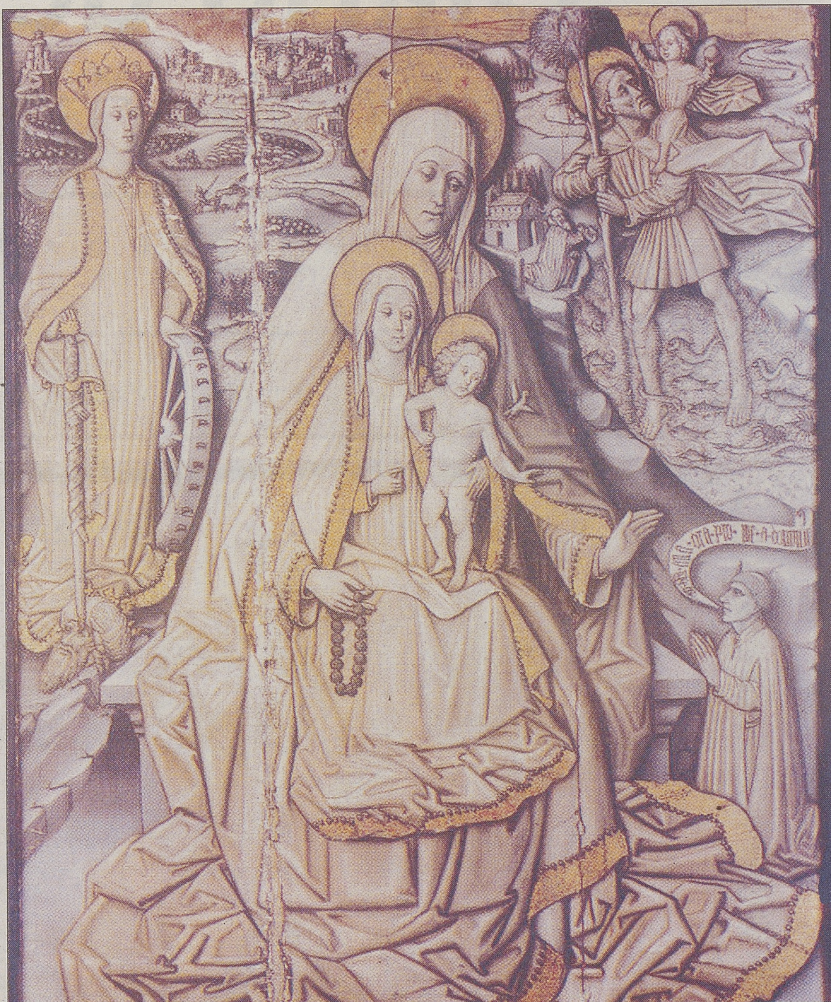
'Santa Ana con la Virgen y el Niño' procede del Museo Catedralicio de Ávila.

Sansón Delli, el hermano menor de la saga familiar de los Delli, comenzó su formación como