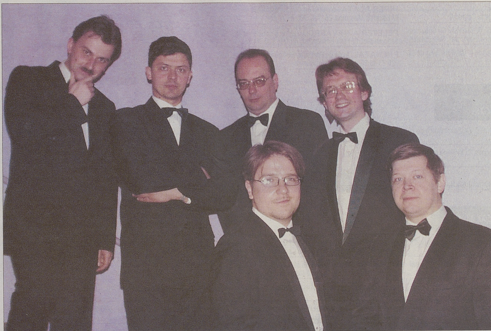
Sexteto integrante del grupo ruso Anima Vocal Ensemble.

Sala de Caja de Ávila en Burgoondo. Visitable todos los días de 19,30 a 21,30 horas, y los festivos, también de 12,00 a 14,00.