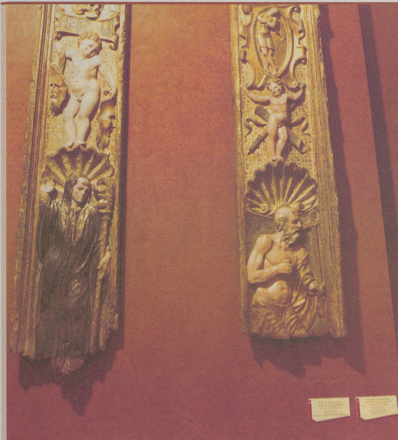
Detalles de la San Jerónimo y San Benito en las pulseras del retablo de Cantiveros que se pueden ver en Las Edades.

visitaron 'Testigos' durante las seis primeras semanas