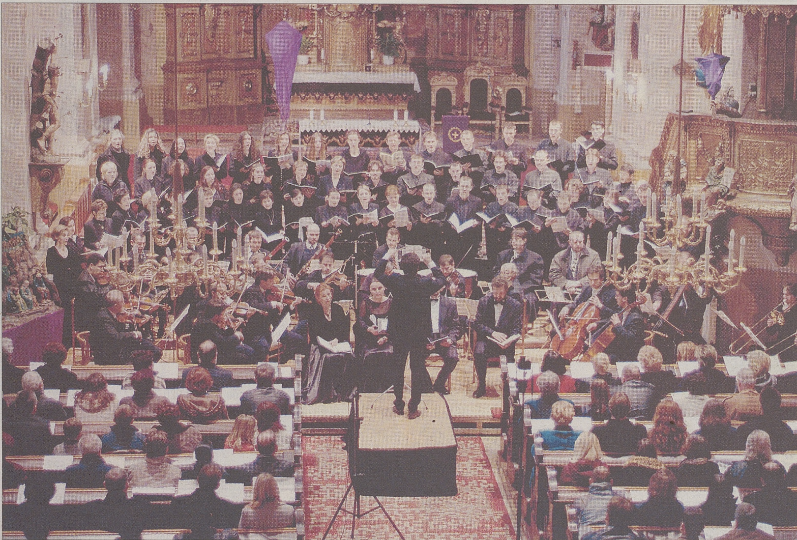
El coro de cámara eslovaco 'Música Vocalis' es el único especializado en la interpretación de la música antigua de la ciudad de Trnava.

Sala de Caja de Ávila en Burgohondo. Visitable todos los días de 19,30 a 21,30 horas, y los festivos, también de 12,00 a 14,00.