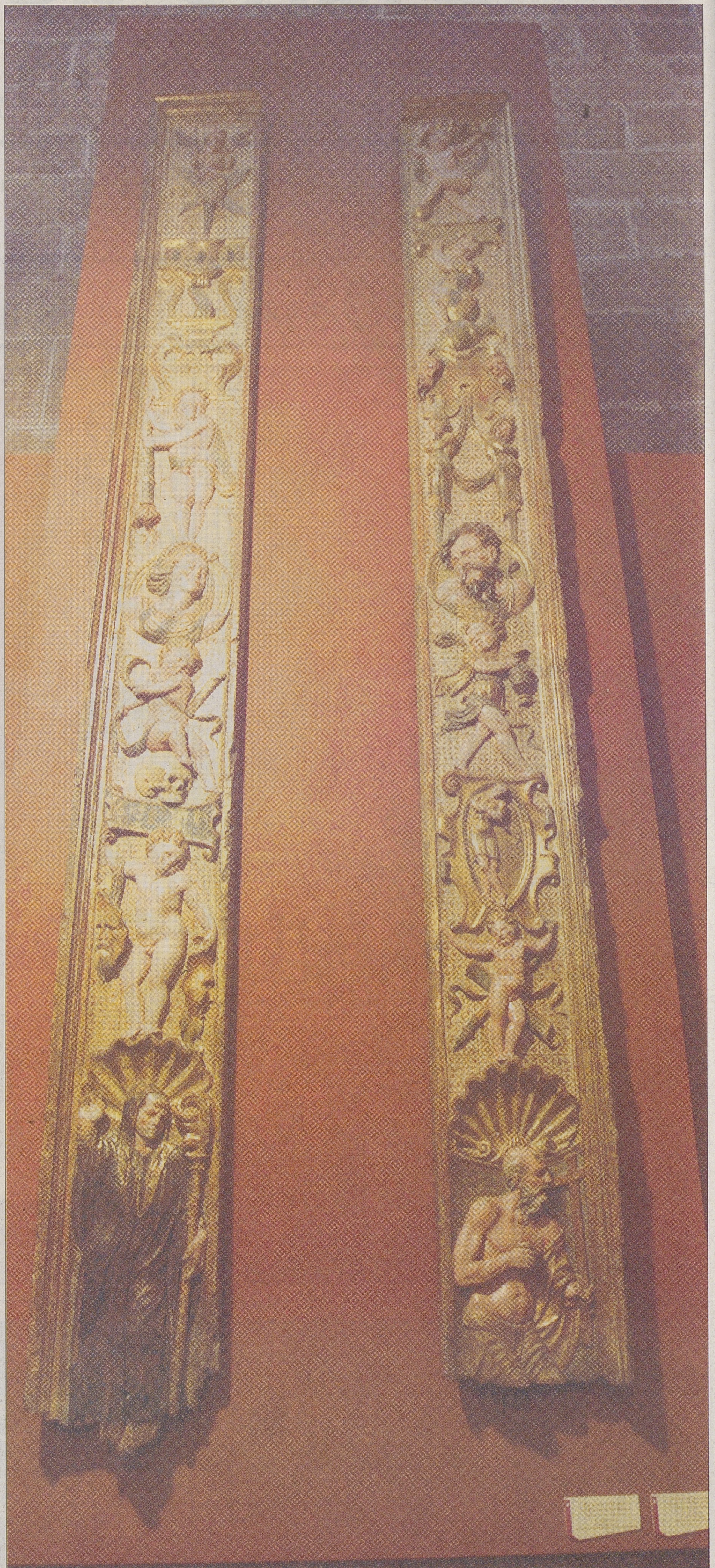
Fragmentos de la pulsera de un retablo del siglo XVI.

Cuando murió Doña Urraca, su hijo fue coronado como rey de Castilla. Alfonso VII 'el Emperador' nunca olvidaría la fidelidad y el arrojo de los abulenses.