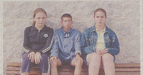
►IES GREDOS / PIEDRAHÍTA «Descubrimiento de la Virgen»

Hace muchos muchos años en la villa de El Tiemblo, un niño que paseaba con su padre por el bosque, se descuidó encontrándose en poco tiempo solo y sin encontrar el camino a casa. Pasados 7 días encontraron a aquel niño jugando con unas pequeñas piedras. Cuando volvía a casa con sus padres, al pasar por la Ermita de San Antonio, el niño se paró y dijo: «yo a ese hombre le conozco»; ese hombre me alimentó, dándome pan y agua y me cuidó, dándome cobijo durante los 7 días en los que estuve desaparecido. Éste es uno de los muchos milagros que realizó San Antonio en la villa de El Tiemblo.