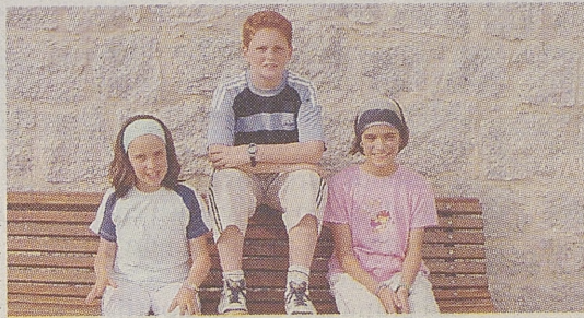
►C.P. TOROS DE GUI SANDO / EL TIEMBLO «Milagro de San Antonio»

Hace muchos años en un castillo vivía un rey que tenía una hija que se llamaba Magalia. Ella se iba a casar con un príncipe. Su padre, Magal, invitó a los reyes más importantes del mundo y también invitó a un centauro que era muy amigo suyo. El centauro cuando vio a la princesa se enamoró de ella y al tener envidia echó unas pastillas en el vino del príncipe. Magalia intentó escapar por el pasadizo del castillo al convento tan desafortunadamente que la mordió una serpiente y cayó al suelo muerta. El príncipe que la encontró se tragó una moneda y se ahogó. Ahora cuando hace mucho frío, llueve y es de noche se oye una voz que dice: «hija dónde estás».