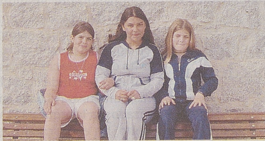
►C.P. VICENTE ALEIXANDRE / LAS NAVAS «La leyenda del castillo»

Hace muchos años en un castillo vivía un rey que tenía una hija que se llamaba Magalia. Ella se iba a casar con un príncipe. Su padre, Magal, invitó a los reyes más importantes del mundo y también invitó a un centauro que era muy amigo suyo. El centauro cuando vio a la princesa se enamoró de ella y al tener envidia echó unas pastillas en el vino del príncipe. Magalia intentó escapar por el pasadizo del castillo al convento tan desafortunadamente que la mordió una serpiente y cayó al suelo muerta. El príncipe que la encontró se tragó una moneda y se ahogó. Ahora cuando hace mucho frío, llueve y es de noche se oye una voz que dice: «hija dónde estás».