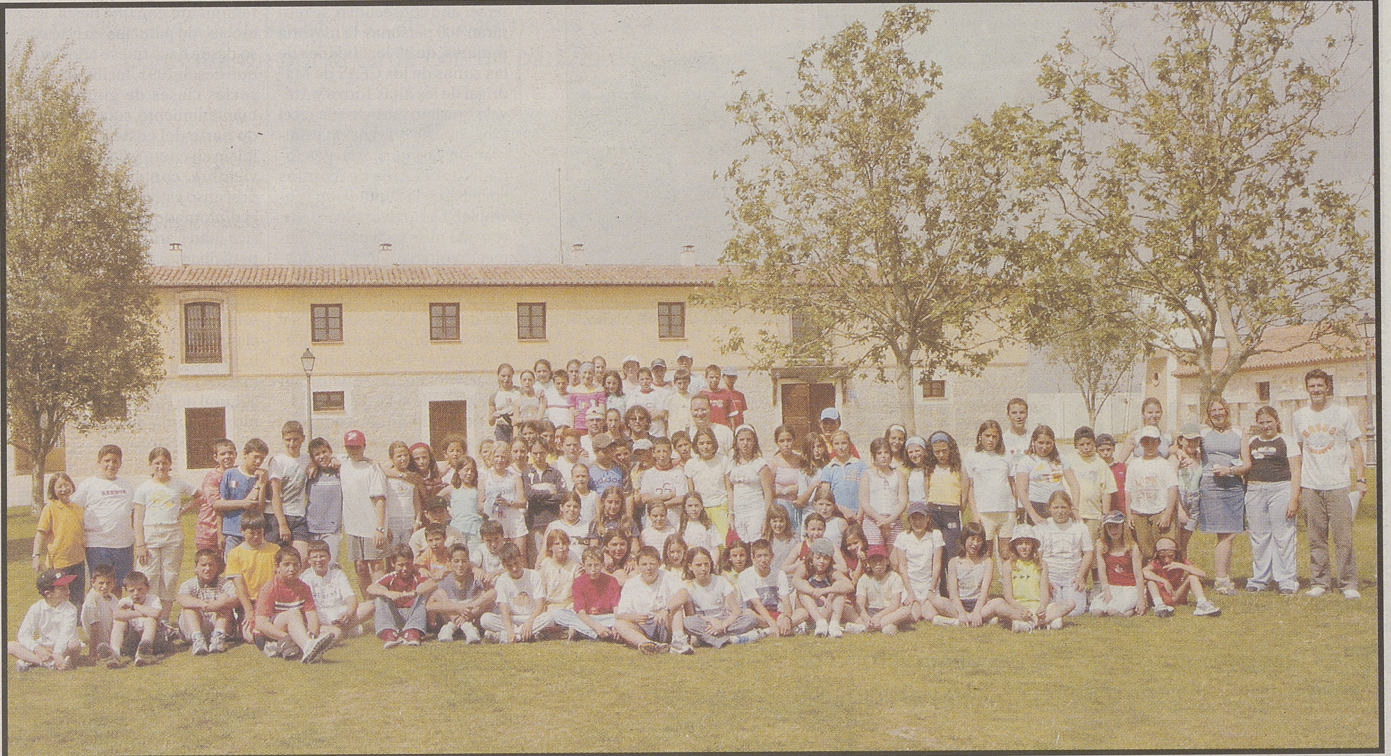
Alumnos del colegio público Vicente Aleixandre, de Las Navas del Marqués; del colegio público Toros de Guisando, de El Tiemblo; y del instituto Gredos, de Piedrahíta.