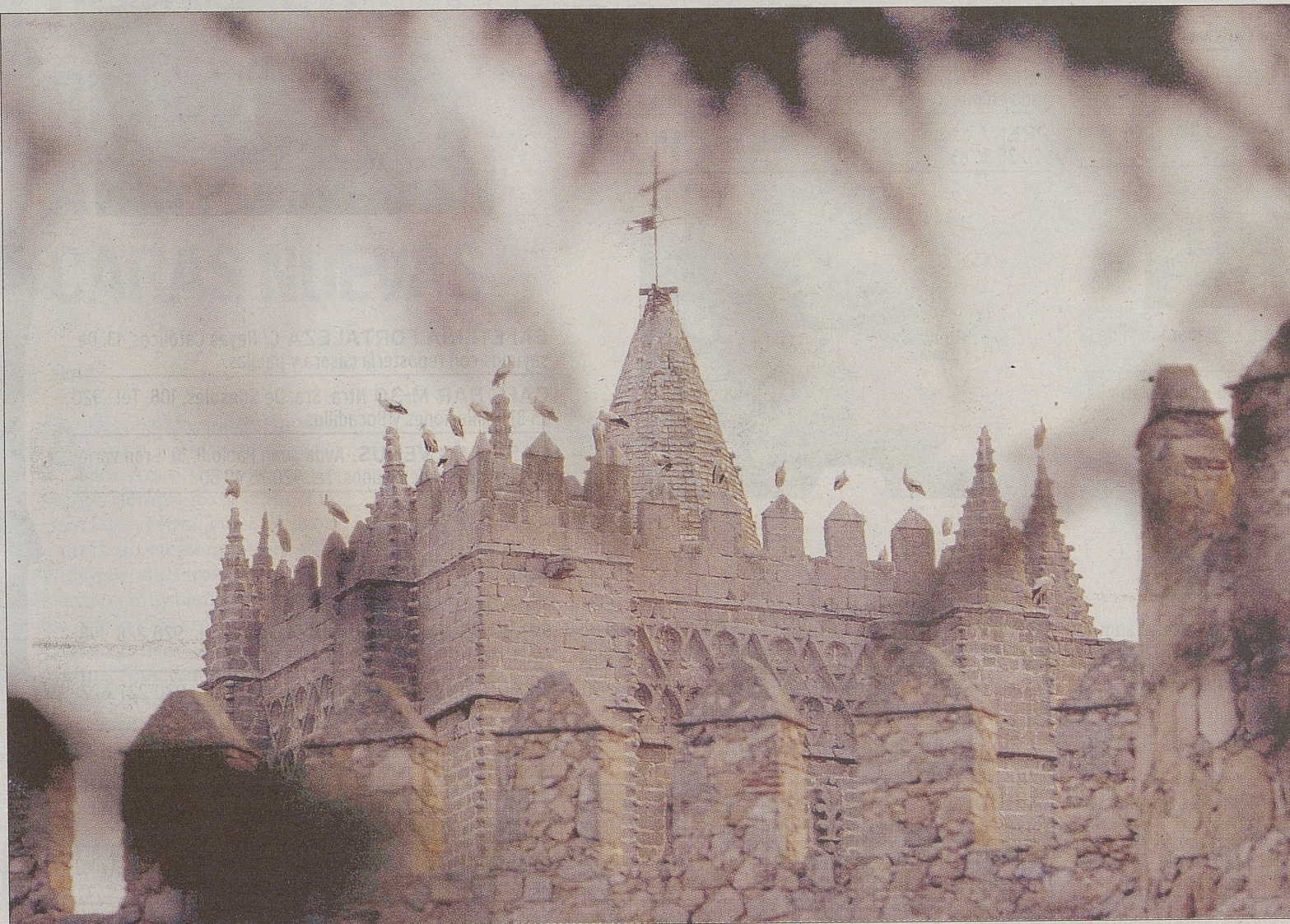
Un grupo de cigüeñas coronan la catedral abulense.

Ubicada en la sala de Caja de Ávila en Arévalo. La exposición puede ser visitada todos los días de 19,30 a 21,30 horas y los festivos, también de 12,00 a 14,00 horas. Hasta el 6 de junio.