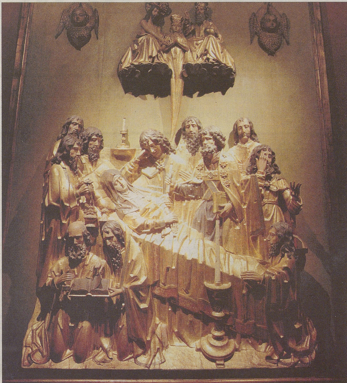
La 'Dormición de la Virgen', de Alejo de Vahía, es una obra realizada en madera dorada y policromada.

Aunque este altorrelieve, procedente del Museo Catedralicio de Valencia y colocado en el primer capítulo 'El fuego del Espíritu', se atribuye a Alejo de Vahía a partir