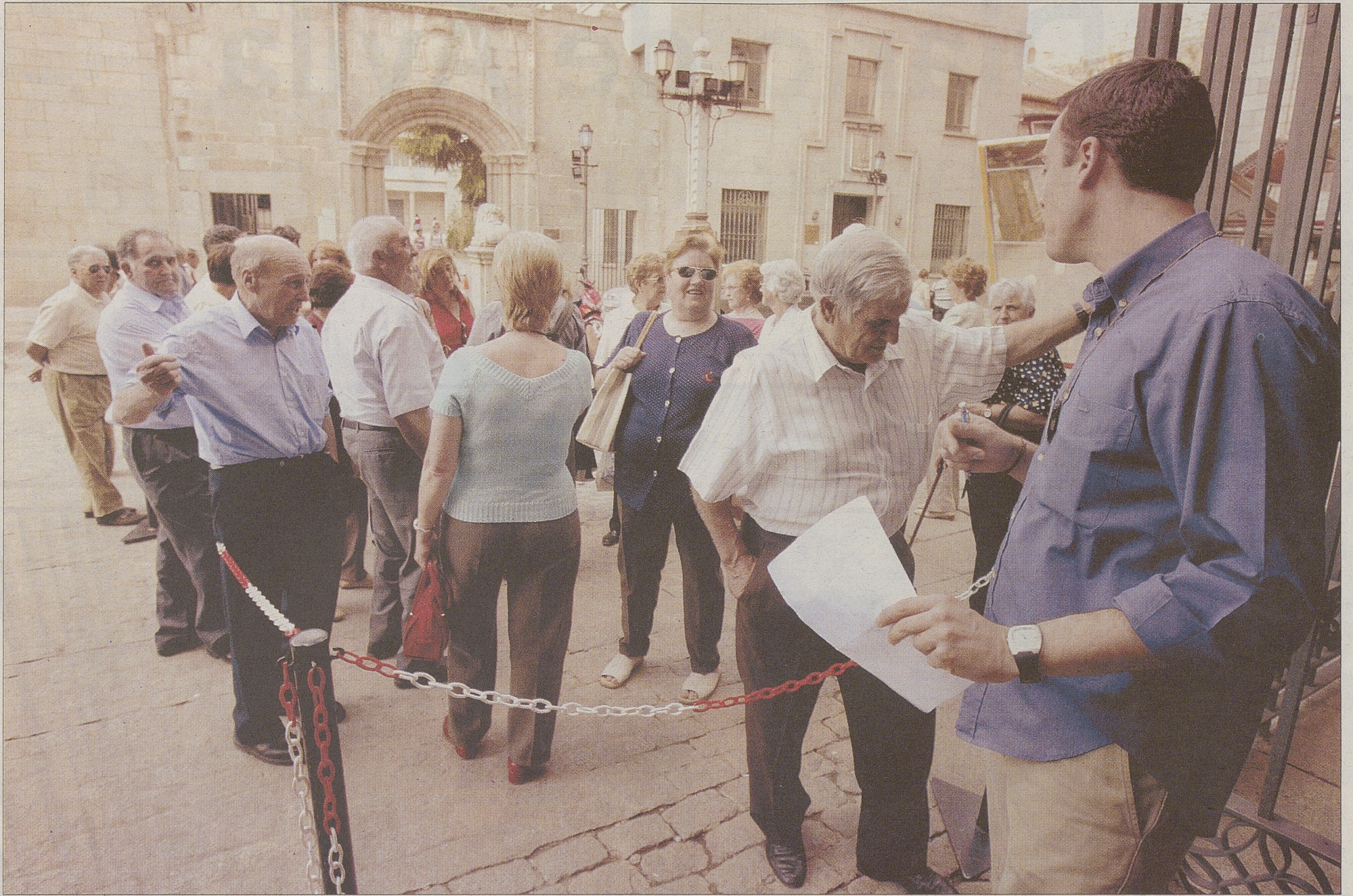
Un guía de Las Edades del Hombre organiza las visitas de la muestra en la entrada a la Catedral.