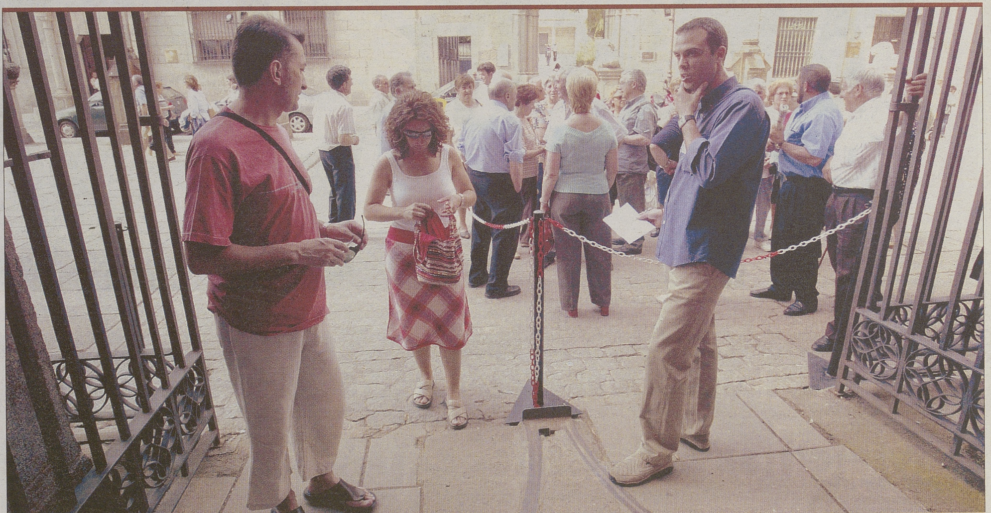
Uno de los guías de Las Edades del Hombre controla la entrada de visitantes a la Catedral, donde se puede admirar la muestra 'Testigos'.

71.619 personas visitaron 'Testigos' durante las cuatro primeras semanas