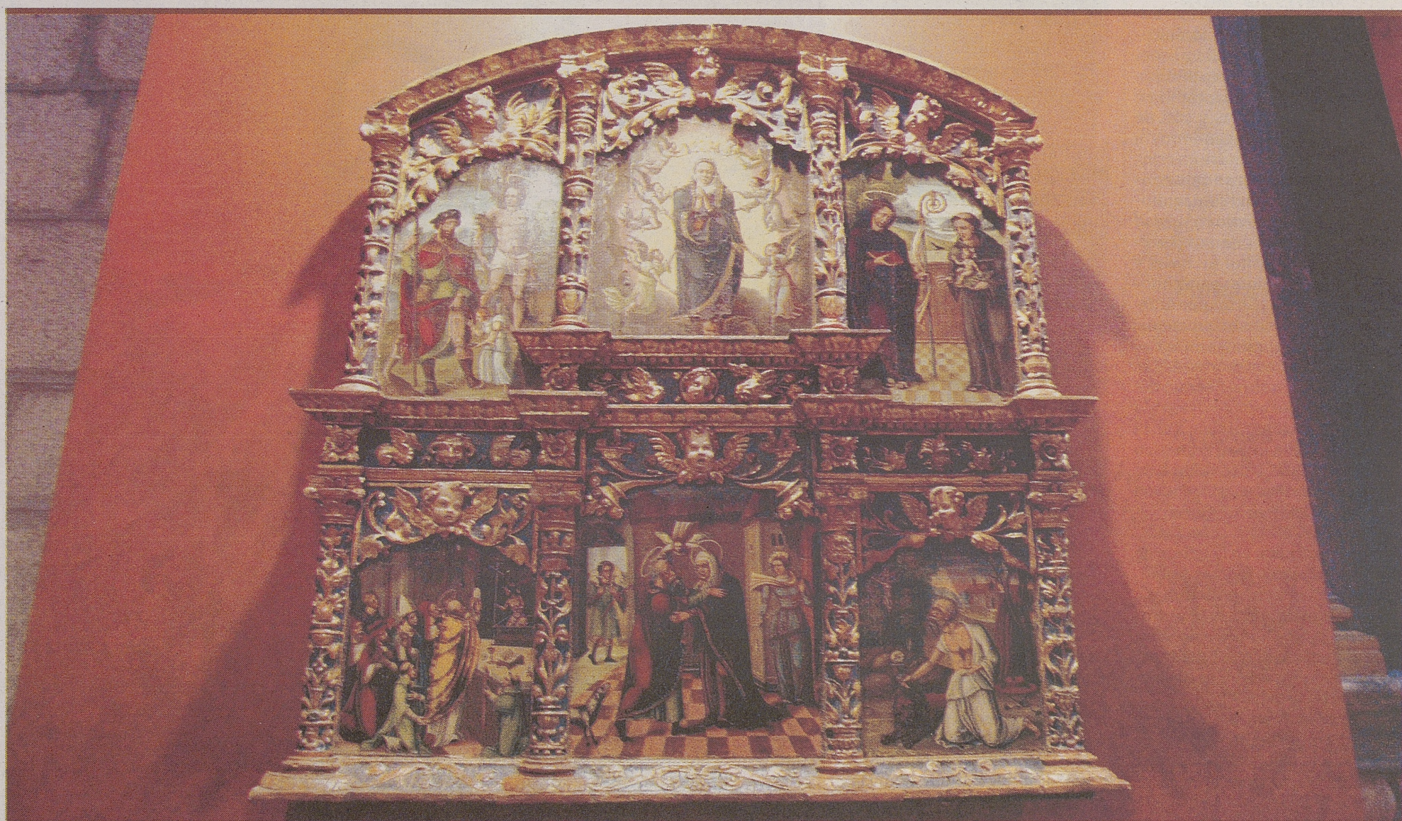
Retablo de la Asunción, del siglo XVI, proveniente de la Iglesia de San Juan Bautista, de Arévalo.

34.057 personas visitaron 'Testigos' durante las dos primeras semanas