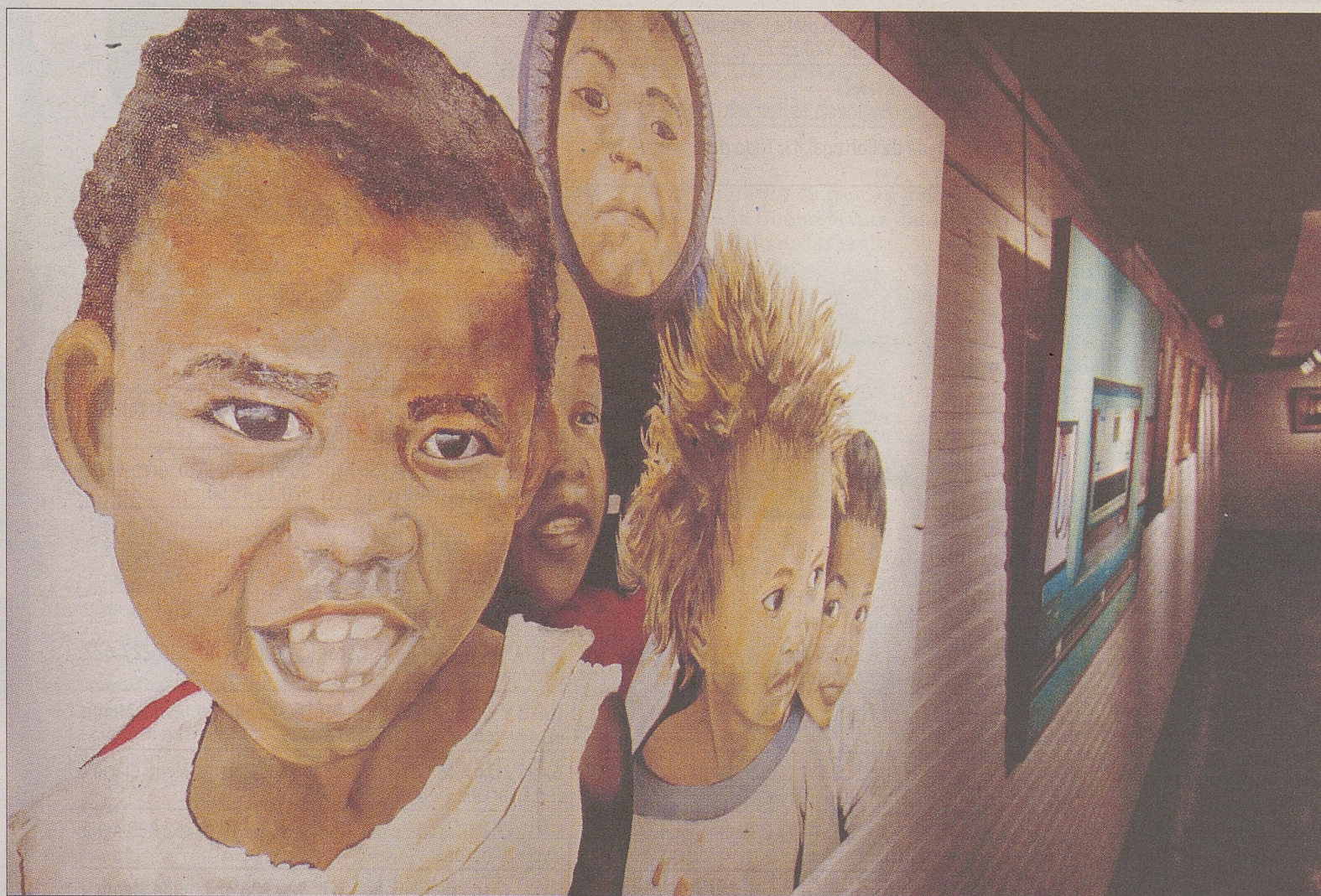
La muestra colectiva de Amigos del Realismo se puede visitar hasta el próximo 29 de mayo en la sala de Caja Duero.