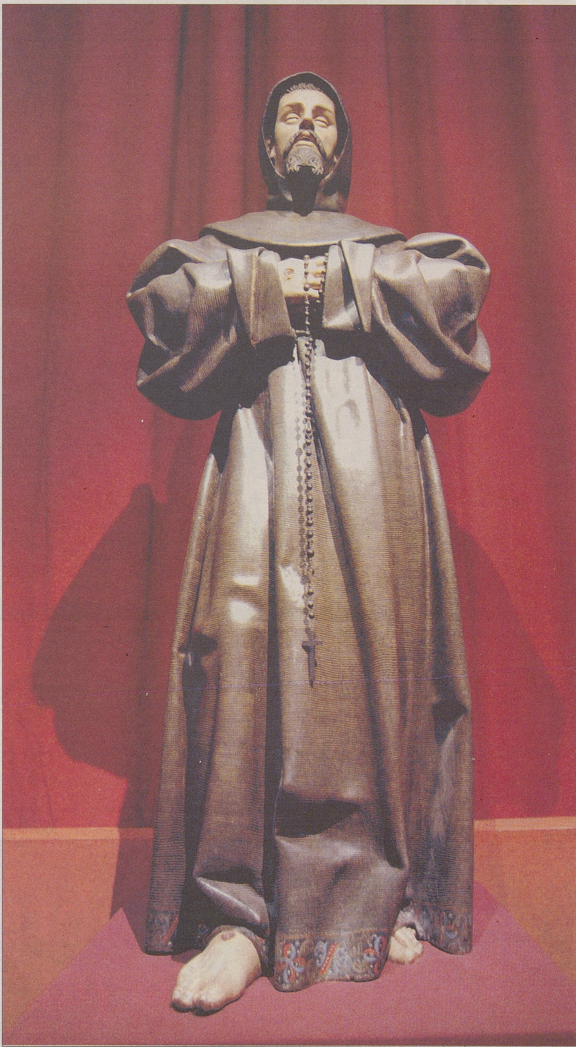
Talla de San Francisco de Asís, realizada por Gregorio Fernández en el siglo XVII.

La Lugareja se encuentra a dos kilómetros de la ciudad, en el lugar llamado «El Lugarejo». Está considerada como una de las obras cumbres del románico mudéjar español. Es una iglesia que perteneció a un monasterio de monjas cistercienses y aunque inacabada, parece que sus formas y decoración están calculadas para ensalzar su belleza. Tiene una cabecera con tres ábsides con largas arquerías ciegas y sobre el presbiterio del central se eleva sobre pechinas una cúpula de doble cuerpo imitando los cimborrios de Salamanca y Toro. Externamente esta cúpula se convierte en un macizo cúbico adornado con arcos ciegos y una ventana en cada cara. Pero con todo y esto, Arévalo es más. Sólo con verlo.