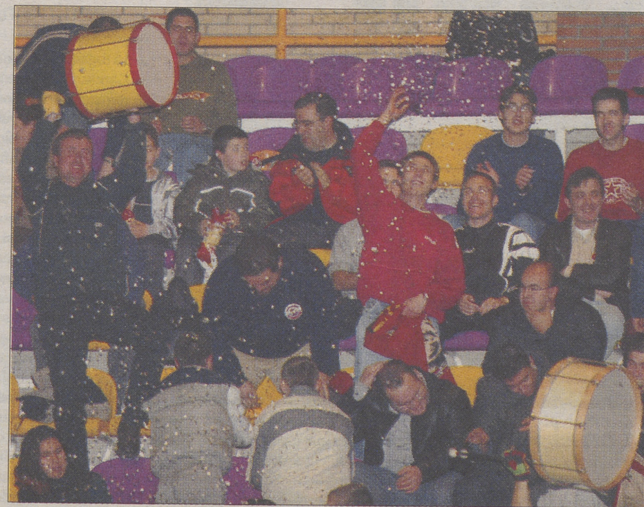
Aficionados del Caja de Ávila celebrando la victoria.

factores, sobre todo de controlar los nervios. Ahí no comenzó bien el set que echó dos balones fuera del saque y estrelló un ataque en red, pero las rusas tampoco fallaron y por ello el marcador se mantuvo apretado, 6-7. El equipo de Belgorod cerró a Barnett, pero el Caja tiró de bloqueo para ganar un 3-0 de parcial que le permitió cambiar de campo con ventaja. Las rusas dejaron escapar dos puntos de ventaja, 10-8, en el primer parcial, con Elena Sytcheva y la colocada Svetlana Levina. Y si en todos los sets el equipo abulense había presidido el set, en el quinto no iba a ser menos. Después de tres sets, en el quinto, el favor de las locales y uno particular de Barnett daba un triunfo brillante al Caja de Ávila, que le abre las puertas de la Final Four,