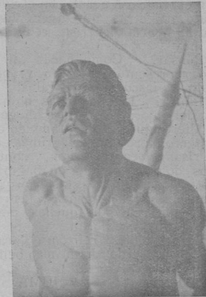
Detalle del Modelado de Mir