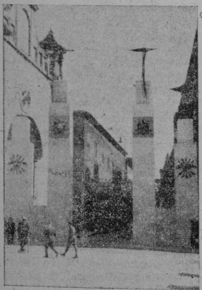
ENTRADA A LA CALLE DE SAN MIGUEL

Cuando tuvimos que salir de la Catedral, sin haberse terminado el solemne oficio para poder informar a nuestros lectores, el gentío que todavía se dirigía a la misa por las calles del General Goded, Plaza de Cort y Colón, era un verdadero hormigúeo humano, que dificultaba grandemente el tránsito.