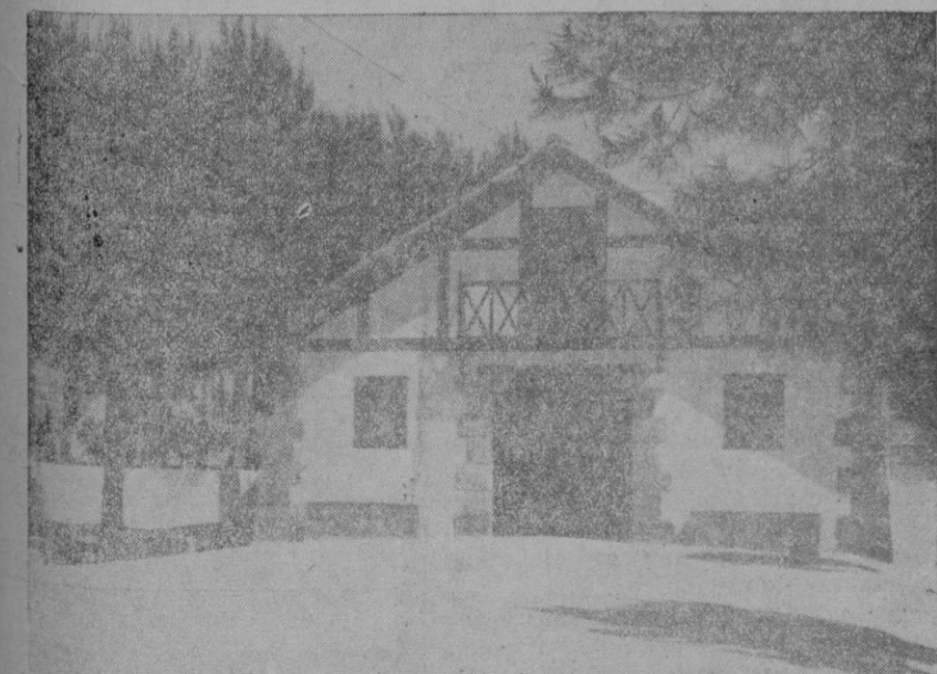
EL CASERIO VASCO DE LA VERBENA