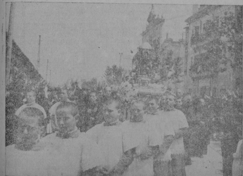
LA ESCOLANIA DE LLUCH ENTONA UNA SALVE