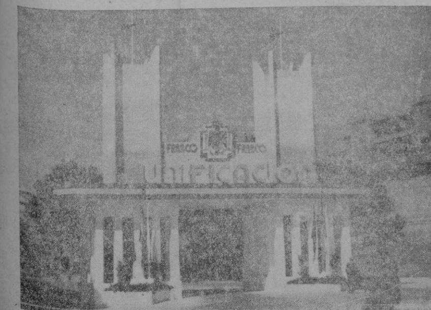
ARCOS DE TRIUNFO