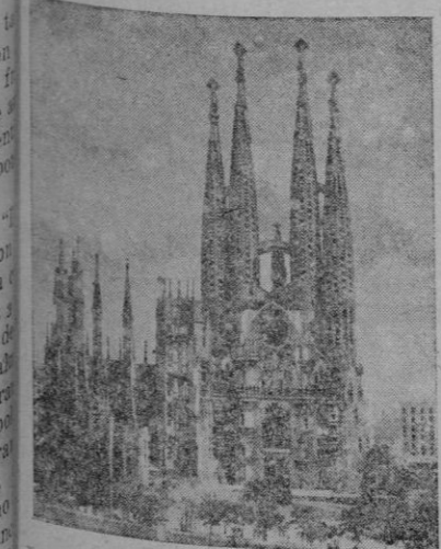
Las torres penitenciales que el genio de Gaudí concibió para el templo de la Sagrada Familia, hablan de Barcelona española y de Barcelona presente. Son la concreción magnífica de una raza y de una fe.