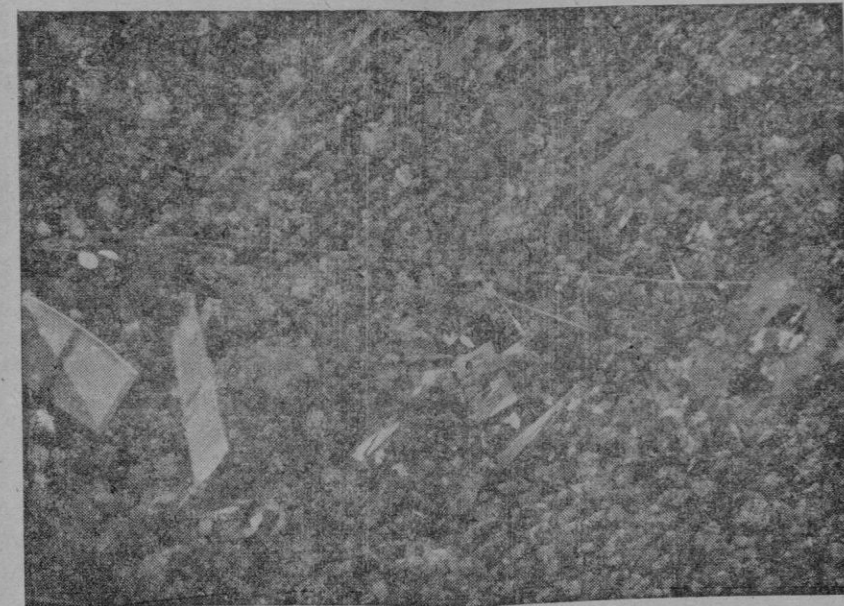
LA PLAZA DE CORT REPLETA DE BANDERAS Y DE MULTITUD ENTUSIASTA