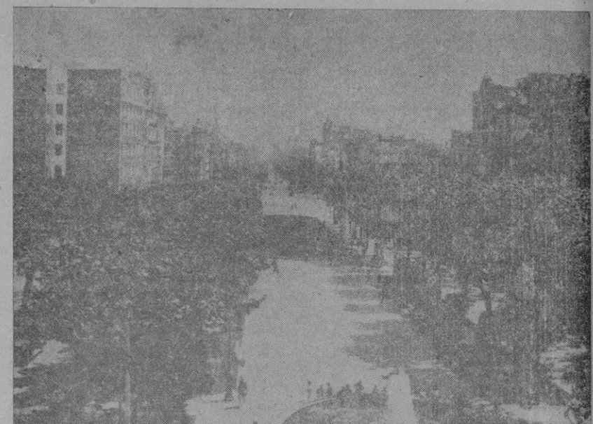
LA BARCELONETA LA CATEDRAL PASEO DE GRACIA