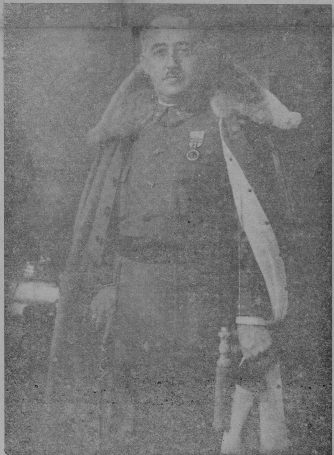
Francisco Franco Bahamonde

Palma Nacional sindicalista vibró ayer de emoción española