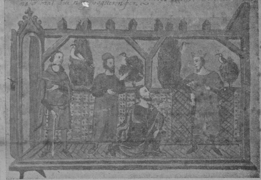
EL REY CONQUISTADOR, RECIBIENDO UNOS NOBLES (Grabado de la época)

Desde el 31 de diciembre de 1229 esta tierra nuestra es España. Por este día salió la Isla de manos abrumadoras que la oprimieron con sus ansias de piratas, con su fe tan lejana de las creencias antiguas de aquellos a quienes oprimían. Por este día el devanar de los años ha hecho de los mallorquines españoles dotados de todas las noblezas de la raza y aureolados con todos los prestigios y los laureles todos que son gloria de España. Y hoy, en nuestra contribución de entusiastas y