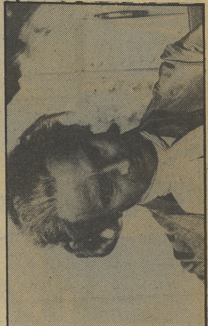
«Mozart», se despide de la programación

21.05 UN, DOS, TRES... «El mundo del disco».