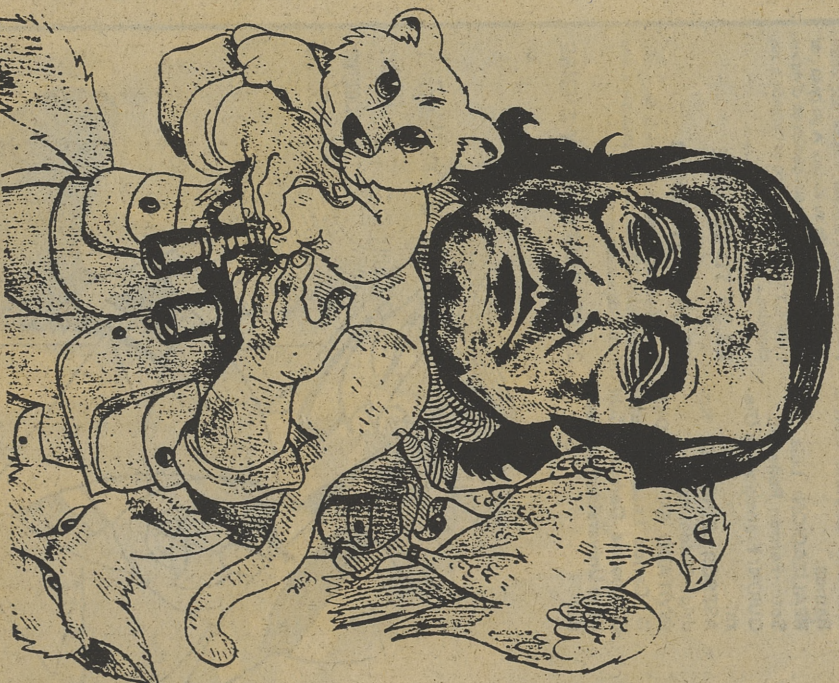
Félix Rodríguez de la Fuente, el recuerdo constante