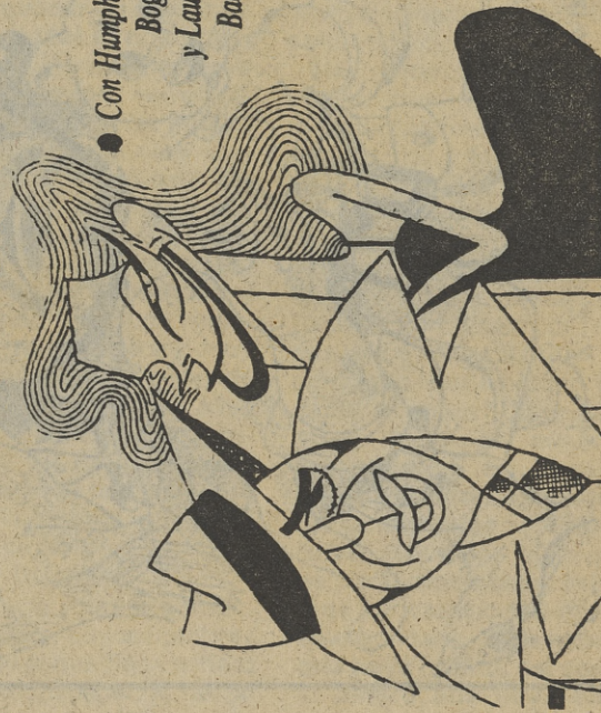
Nada más lógico que esta pareja cierre el ciclo de cine negro