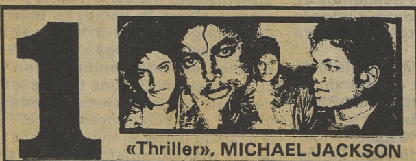
«Thriller», MICHAEL JACKSON