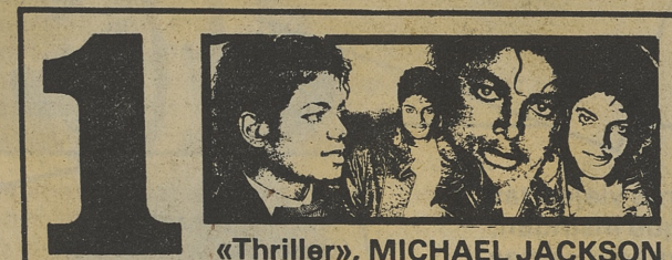
«Thriller», MICHAEL JACKSON