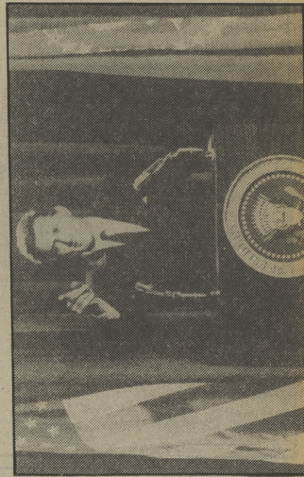
Martin Sheen es Kennedy, en la serie del mismo nombre