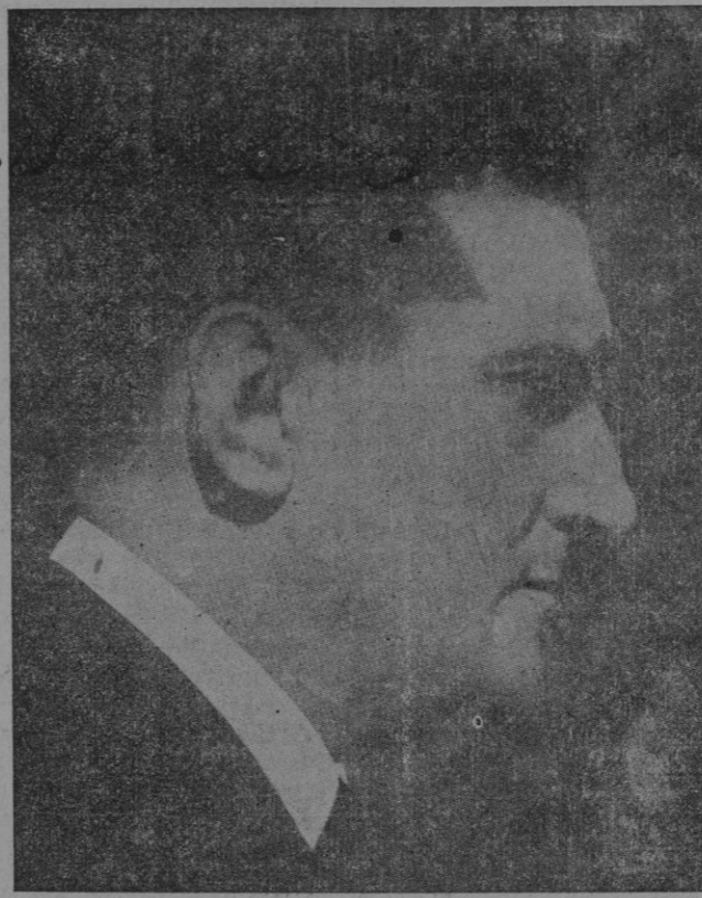
EXCMO. SR. OLIVEIRA SALAZAR, JEFE DEL GOBIERNO PORTUGUES

El material ferroviario quedó casi por completo destruido, y de entre sus restos se han extraído 60 muertos y más de un centenar de heridos.