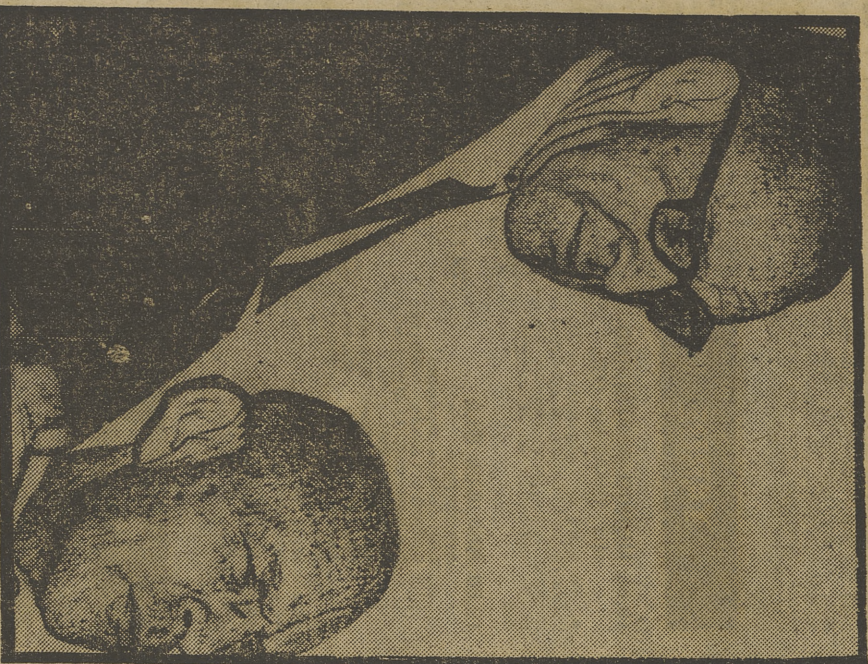
Salvador Espriu, en «Nombres de ayer y de hoy»