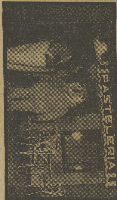
Un barrio con nombre de cuento árabe. Sesamo