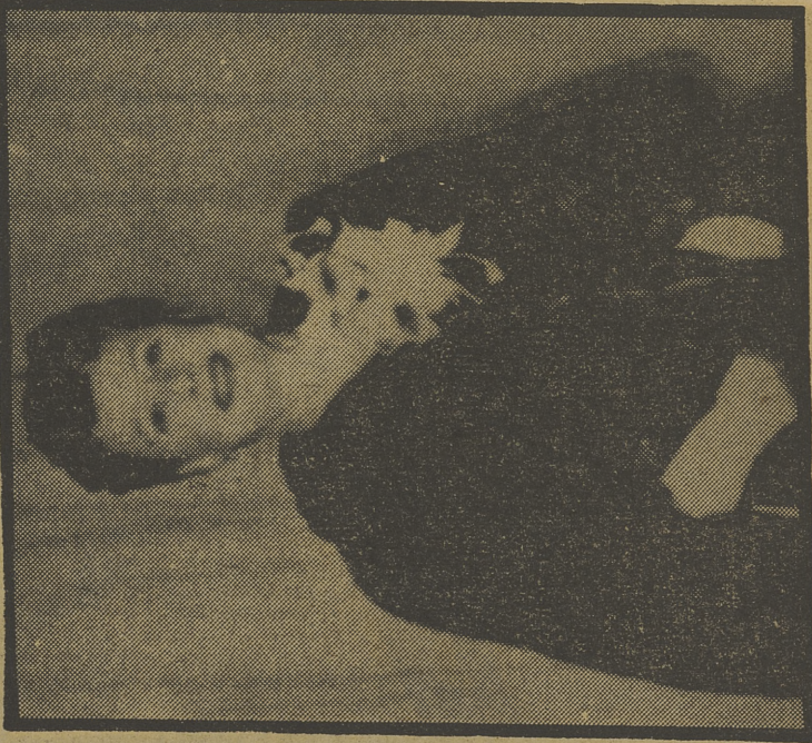
Irene Dunne, en «La usurpadora»

21,35 VUELTA CICLISTA A ESPAÑA Resumen de la etapa del día.