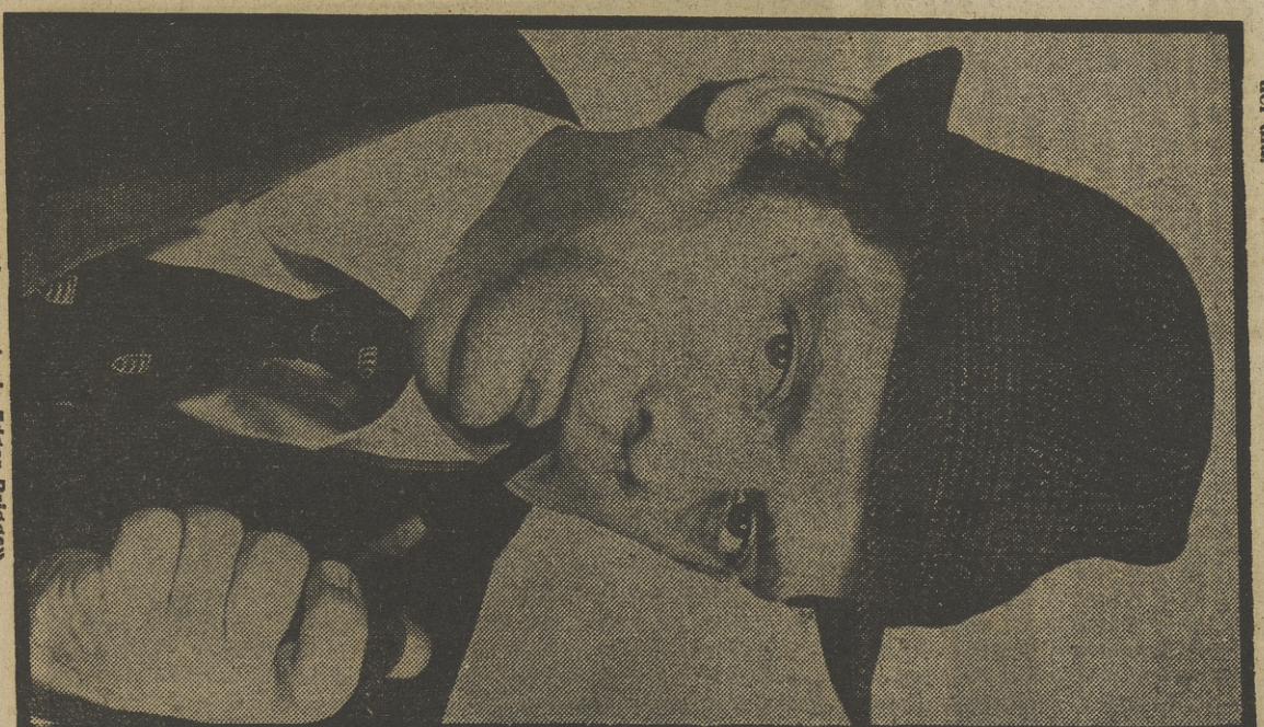
«La vida secreta de Edgar Briggs»

21.00 PRODUCCION ESPAÑOLA 0.30 DESPEDIDA Y CIERRE