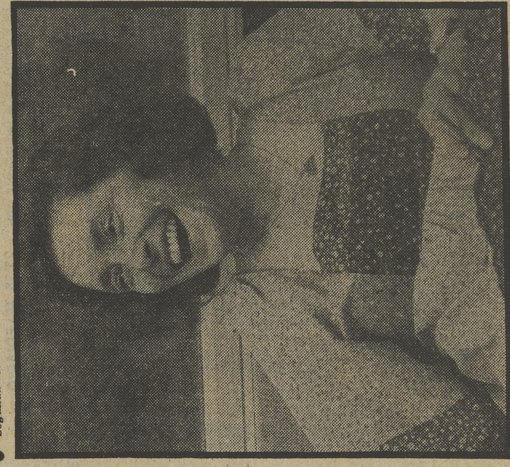
Patricia Neal, en una importante película: «Hay que matar a B»