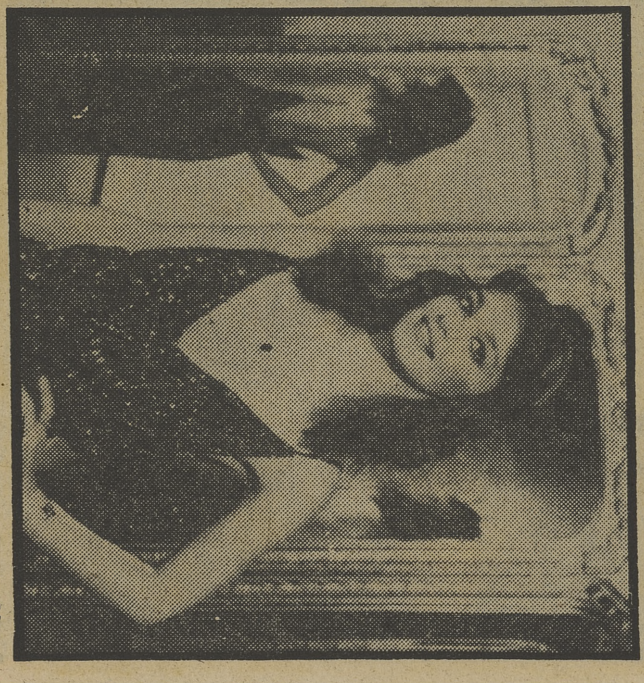
«Dinastía» ha protagonizado su permanencia en la programación

● La residencia de los Bellamy va a ser el insustentado escenario de una representación teatral, a la que asistirán algunos oficiales del Ejército. Se trata de una serie de escenificaciones en las que se tratará de imitar escenas conocidas de la literatura romántica. La representación llevará por título «El adiós del héroe». Sin embargo, hay un papel para el que se requiere la presencia de Ruby, la pincelista de una campaña, puesto que en opinión de las organizadoras, el fin de la obra es el de dar a conocer a Ruby, que debe entrar en escena, soltando un grito en angustia, según el guión, se producen unas tremendas explosiones a consecuencia de un ataque aéreo.