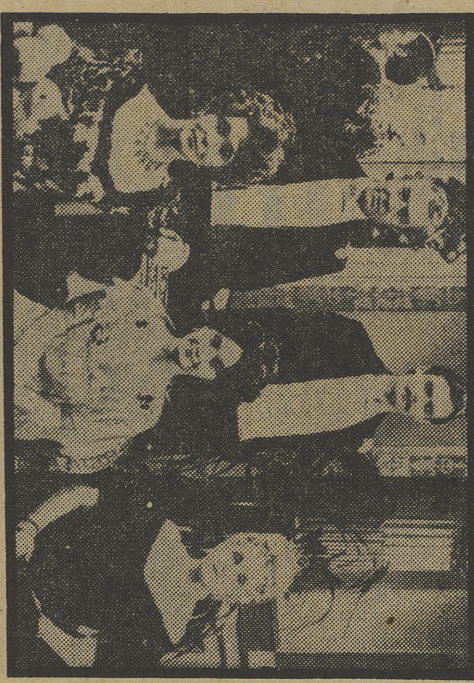
Otra nueva semana con «Arriba y Abajo»

● El regreso a Oxford, Charles y Sébastien, en un momento de su vida del curso anterior. Preocupado por su hijo, lady Marchmain visita Oxford y habla con Charles. Le pide que cante de Sebashtien y que procure ejercer una buena influencia sobre él, ya que no ve progreso alguno en sus estudios ni interés por ellos. ● El ballet, tal como lo conocimos hoy, fue el resultado de una revolución en el mundo del ballet en el momento de la revolución. No sólo era un espectáculo, sino que también intentó que el ballet fuera una profesión. Desde entonces las técnicas del ballet han sufrido muchos cambios. Margaret Fonteyn examina la tradición de la coreografía francesa y su desarrollo en el mundo de la danza.