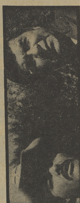
«Las desventuras del sheriff Lobo», una serie vulgar