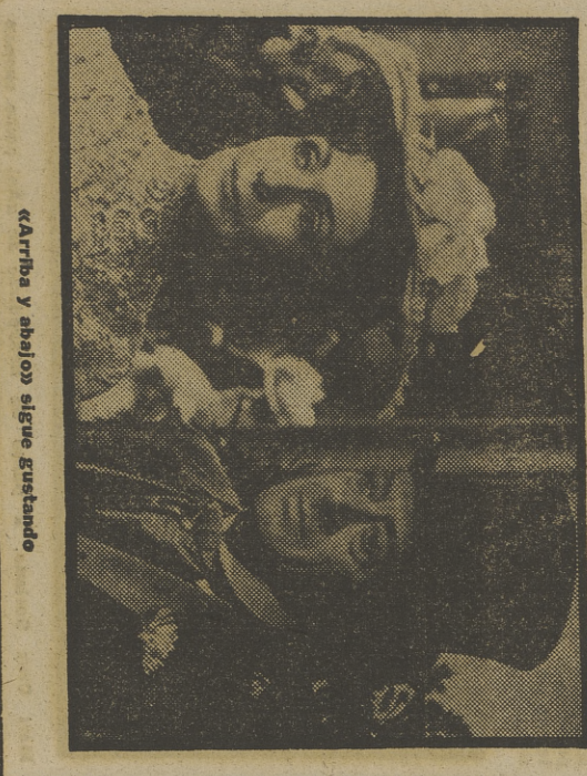
«Arriba y abajo» sigue gustando

Fallo, que ha ido a visitar a su hermano, encuentra una preadmiradora de mujer en uno de sus procedimientos. Steven admite que se ha visto con una mujer y que no puede describir su nombre, porque es casado. La llegada de Jeff Colby, que acude a cenar con ambos, cambia el desarrollo de la conversación. Esta furiosa porque no puede trasladarse a Nueva Orleans, como su deseo, debido a la insistencia de Blake, que no quiere separarse de su hijo.