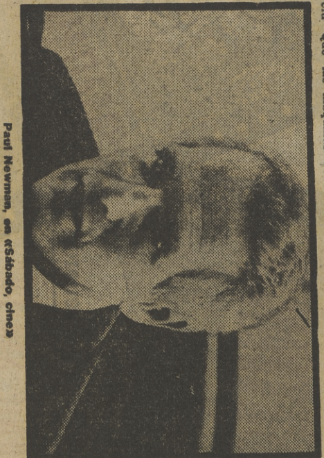
Paul Newman, en «El Premio», cine.

0,50 ULTIMAS NOTICIAS 0,55 DESPEDIDA Y CIERRE