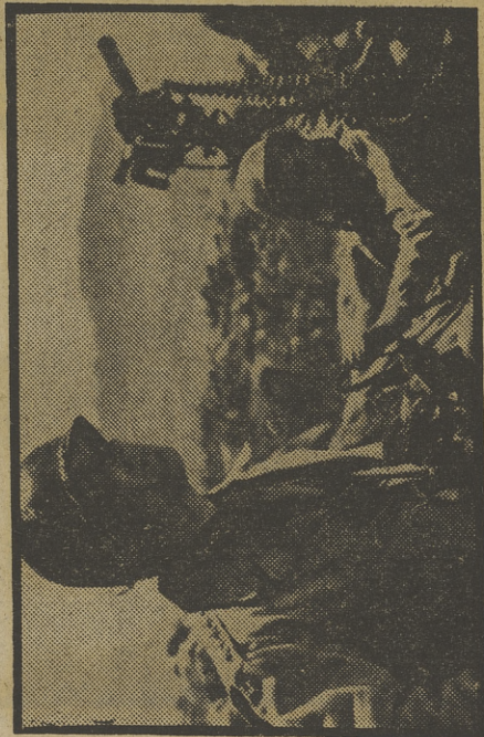
Una serie prometedora: «Ike»