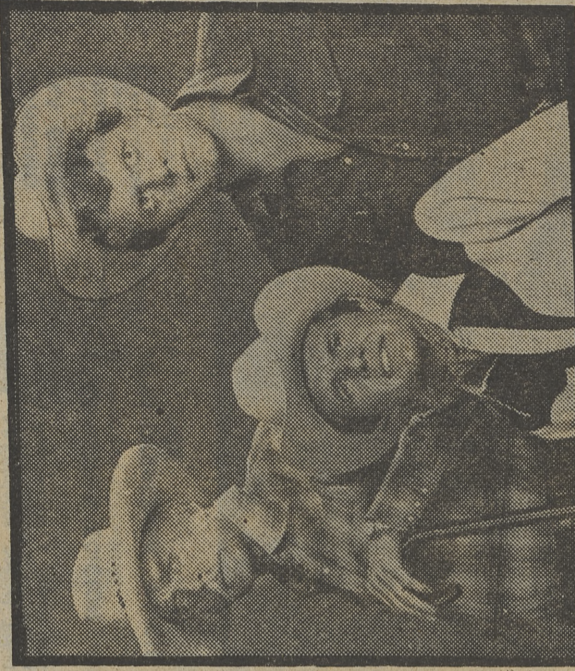
«El Gran Hawái» entretiene en el UHF