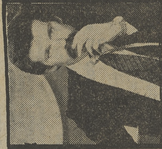
José María Inigo.