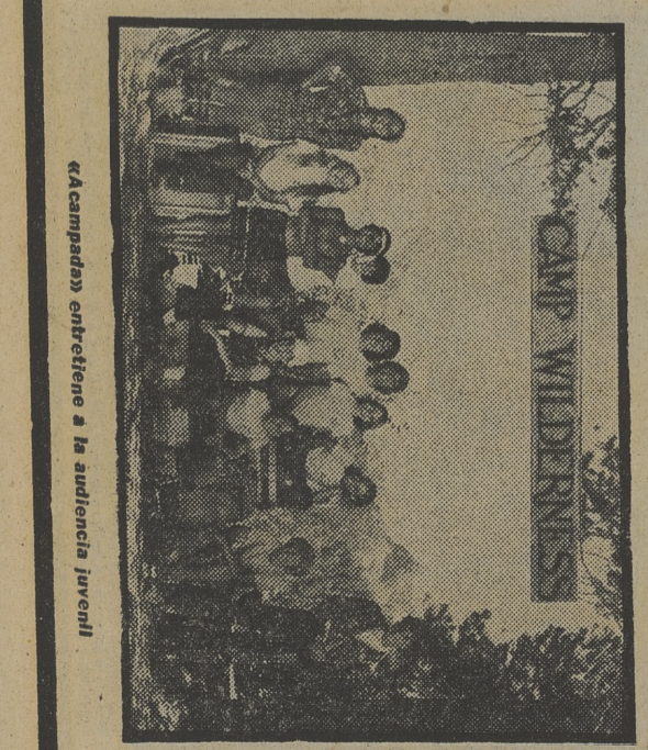
«Camp Wildber» entreteñe a la audiencia juvenil