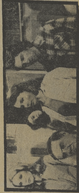
«Skag», una serie prometedora