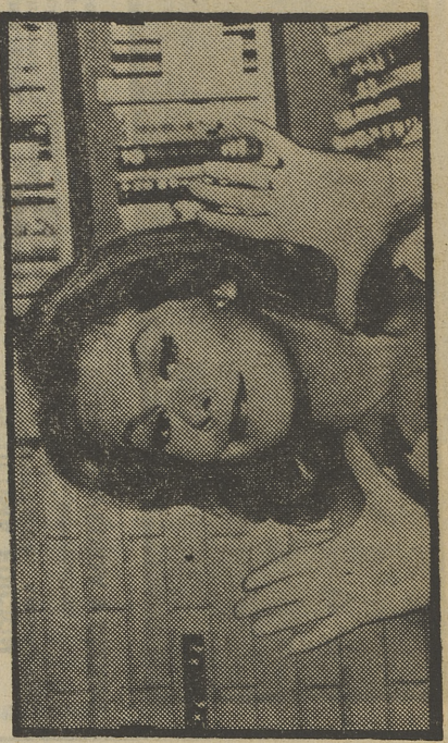
«EMBRUJADA», EN «DE NUEVO»