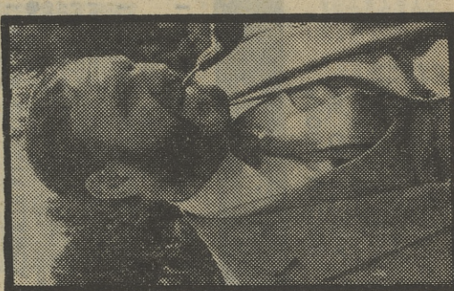
JOSE LUIS BALBIN, DIRECTOR DE «LA CLAVE»

20.30 LA CLAVE Presentación, Largometraje, Coloquio. DIRECTOR Y PRESENTADOR: José Luis Balbin.