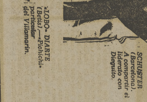
IGOB-DIARTE (Betis). —Fichichis por buscar del Villamarín.