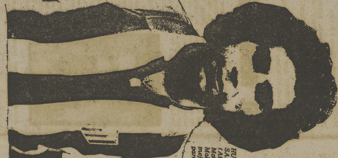
HUGO SANCHEZ (Atlético de Madrid). Malabarismo mejicano para una Liga.