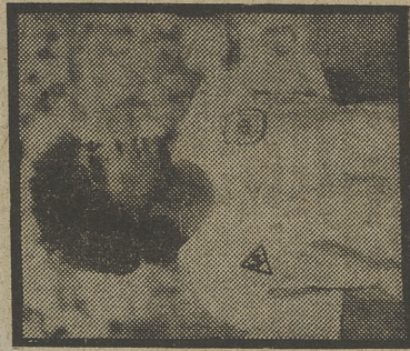
Maradona. Sobran más palabras.