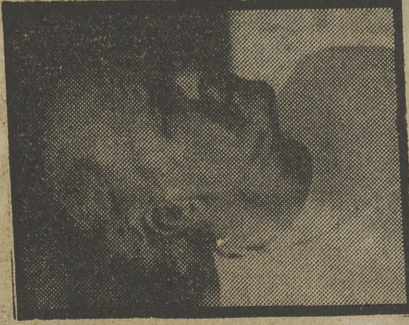
Vuelve la Saeta Rubia

El Real Madrid, eterno favorito al título de Liga, inicia una campaña muy especial en la historia del club: por un lado, la incertidumbre de las elecciones a la presidencia; por otro, la llegada, el retorno de una figura como la de Di Stéfano a la dirección técnica del equipo; y, por el otro, la descompensación tan grande existente en la primera plantilla de la entidad, que, sobre el papel, tan sólo en el papel, se ve a grandes distancias de su máximo rival (de cara al título) el Barcelona. El Madrid ha perdido fuerza en los estamentos vivos del fútbol y ahora puede sufrir en sus carnes las consecuencias y el Madrid ha perdido potencia, fuerza, clase y técnica, en el bloque de su conjunto. Di Stéfano, que tiene la gran virtud de situar a cada jugador en su sitio, se las ve y se las desea para confeccionar un equipo con aspiraciones. La "Saeta Rubia" se ha quejado de que tiene más defensas que hombres de ataque, pero su queja más elocuente, a la vez que silenciosa, es la de que todos los ensayos los está realizando con un clásico 4-4-2, des-