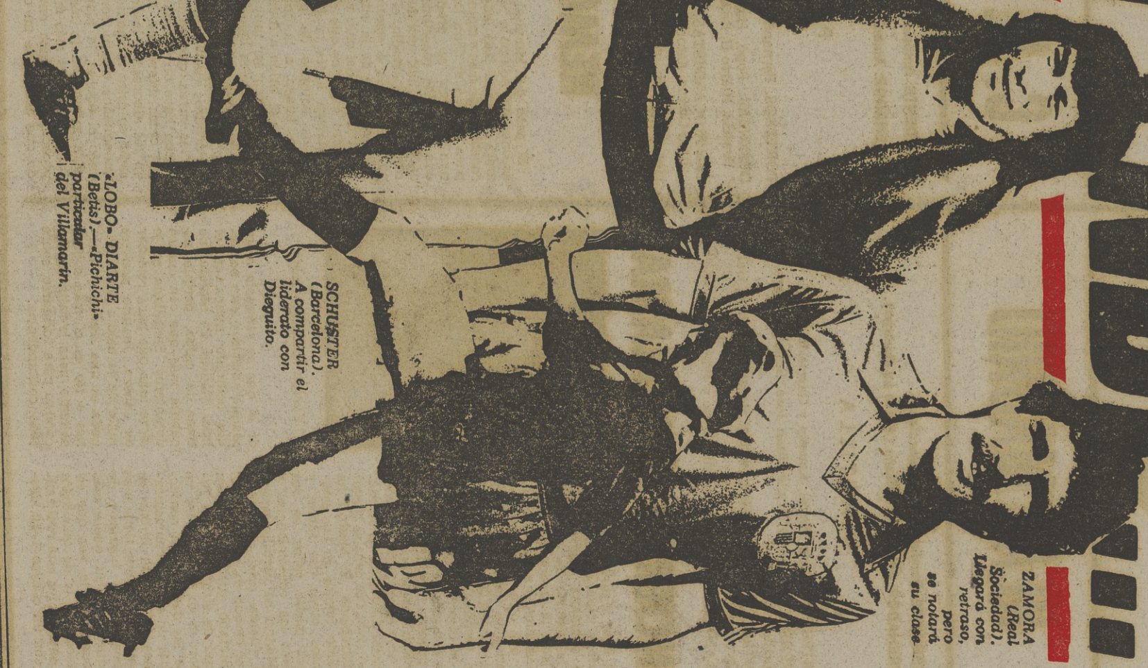
ZAMORA (Real Sociedad). Llegó con retraso, pero se notará su clase.