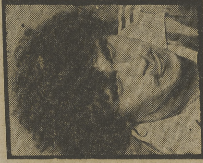
Valdano, una figura argentina.

Fortes y García Navajas son dos de sus refuerzos más significados, en una plantilla compensada y en la que sigue siendo el líder indiscutible el morenito Gilberto.