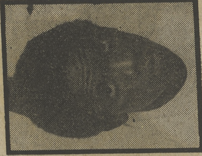
Costly, un harduereño para el Málaga.

El paso del Mundial y el ascenso del equipo a la Primera División han sido dos coordenadas de importantes para que en el Club Deportivo Málaga se produjera una serie de reacciones en cadena, que han servido para remodelar el estadio, el equipo, la política a seguir por los dirigentes de la entidad, la estructura del club y otros muchos aspectos que elevan al Málaga hasta la atalaya de los equipos de primer orden. Luego, a la hora de ponerse el balón a rodar, las cosas pueden ser muy diferentes: el que la bola no entre, la mala suerte se cebe con los malacitanos y que los árbitros vuelvan a hacer cieron hace un par de años, son cosas diferentes. Ahora, en los albores de la temporada, en estos momentos, los malagueños tienen configurado el equipo, la plantilla, para militar en la máxima categoría sin la más mínima preocupación, bien entendido que dentro de un orden.