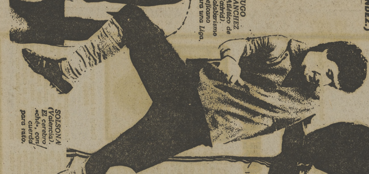
SOLSONA (Valencia). El cerebro «chó», con el cuerno para verlo.