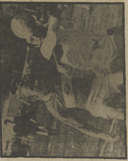
EL SPARTAK DE MOSCU, EN ACCION