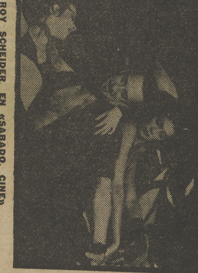
ROY SCHEIDER, EN «SABADO, CINE»