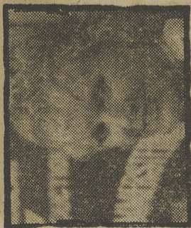
PETULA CLARK, EN LA GALA DE LA UNICEF.

21,00 TELEDIARIO Programa informativo. 21,35 EN ESTE PAIS Programa informativo. 22,35 CULTURAL-82 GRAN GALA UNICEF DE CULTURAL 82.