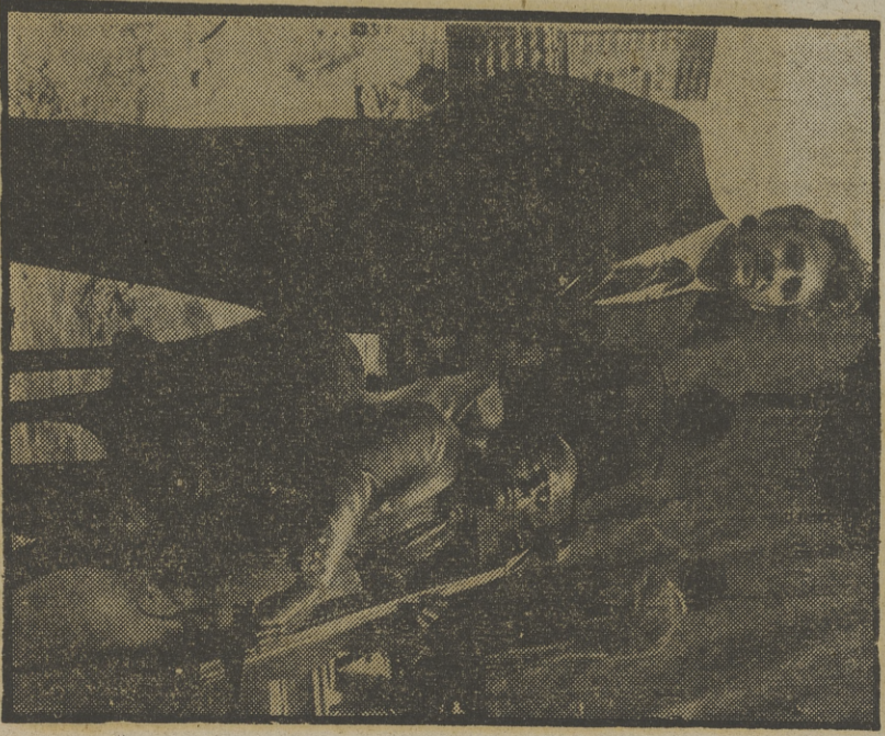
PLACIDO DOMINGO, TODO UN «SANSÓN».