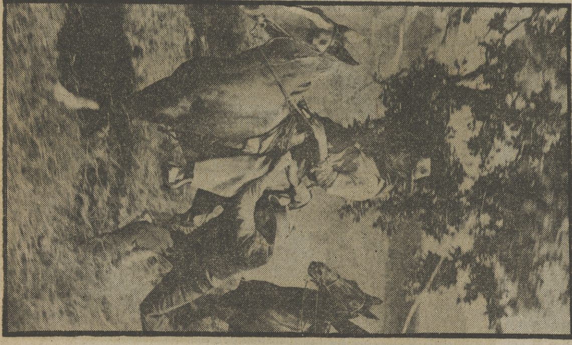
«LA CONQUISTA DEL OESTE», SERIE QUE GUSTA.