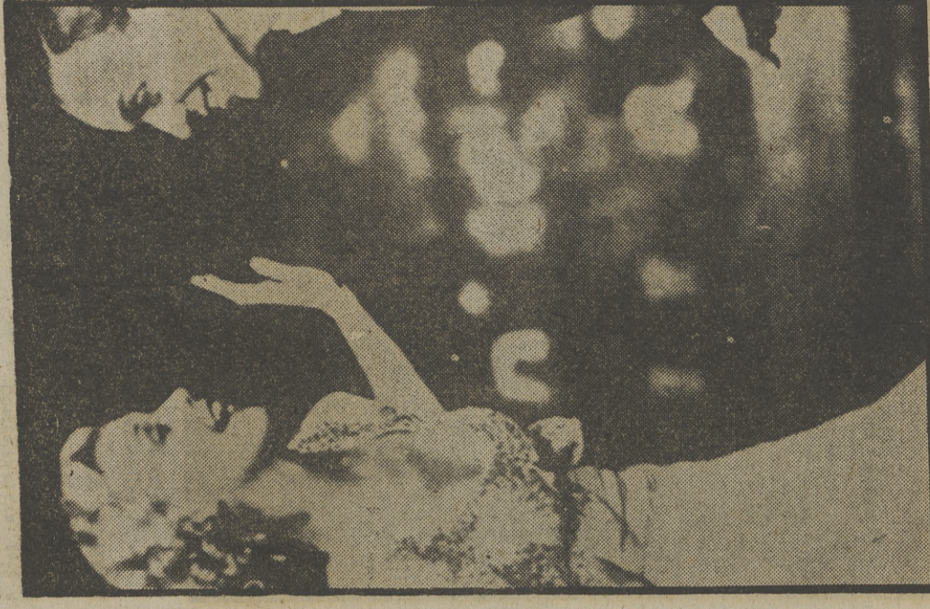
FRED ASTAIRE Y GINGER ROGERS, MITICA PAREJA CINEMATOGRAFICA.