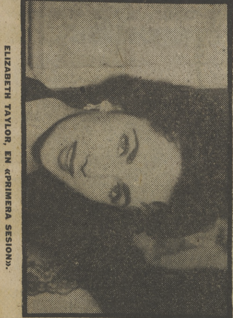
ELIZABETH TAYLOR, EN «PRIMERA SESION».