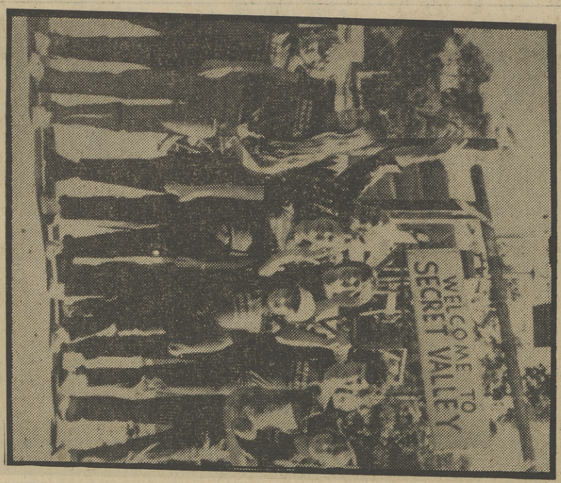
«EL VALLE SECRETO», UNA SERIE ENTRETENIDA