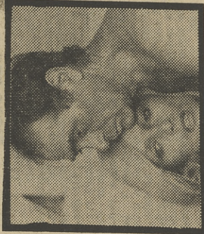
DARREN MCGAVIN, PROTAGONISTA DE «LEY Y ORDEN»

DIRECCION: Marvín J. Chomsky. GUION: Jack Neuman. INTERPRETES: Darren McGavin, Keir Dullea, Robert Reed, James Olson, Biff McGuire, Scott Brady, Will Geer y Suzanne Pleshette.