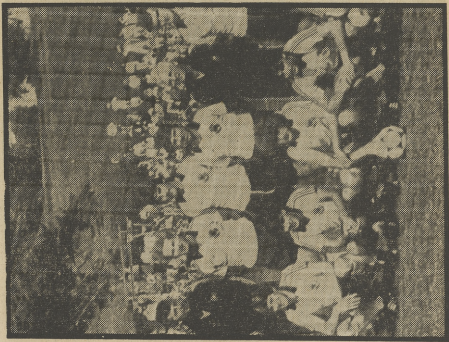
ALEMANIA OCCIDENTAL, UNA DE LAS GRANDES SELECCIONES

00,15 RESUMEN JORNADA 00,45 DESPEDIDA Y CIERRE