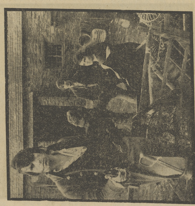
¿SON O NO «CONTRABANDISTAS?»

21,00 SESION DE NOCHE «LA MUJER PANTE- RA» (1942). (Blanco y negro.)