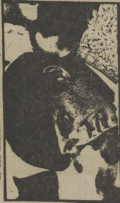
ESPARTACO, desde Jerez de la Frontera

Realizador: José Luis Hernández Batalla. Un panel fijo de periodistas entrevistará a una destacada figura de la vida española.