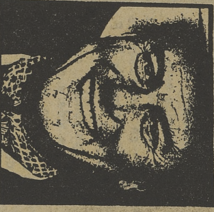
El polémico J. R., la ambición de poder.

«LA MADRE DEL AÑO». Intérpretes: Barbara Bel Geddes, Jim Davis, Patrick Duly, Victoria Principal, Linda Gray, Larry Hagman, Charlene Tilton, Steve Kanaly y David Ackroyd.