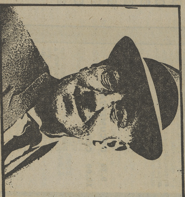
ALEC GUINNESS, tentado y perseguido en «El hombre vestido de blanco»