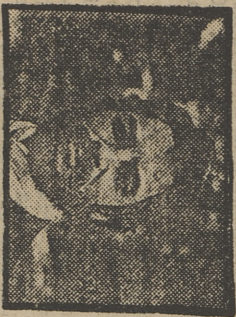
JOHN CASTLE Interpretes: Francesca Annis, Anton Rodgers, Denis Lill, Peter Egan y Jennie Linden.

4,05 LILLIE (Nueva serie.) «EMILIE». (Episodio número 1.)