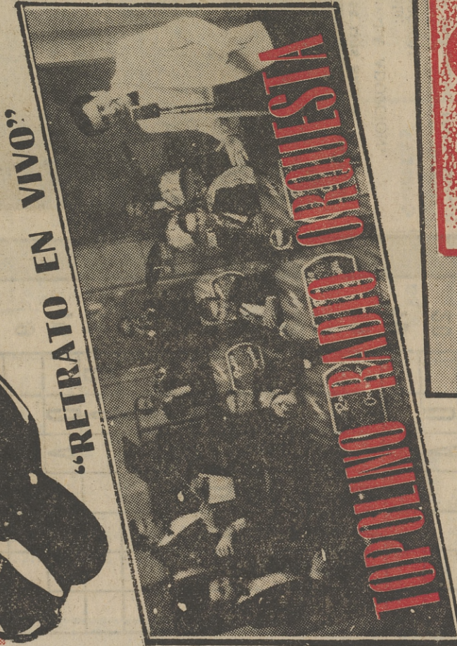
«RETRATO EN VIVO»