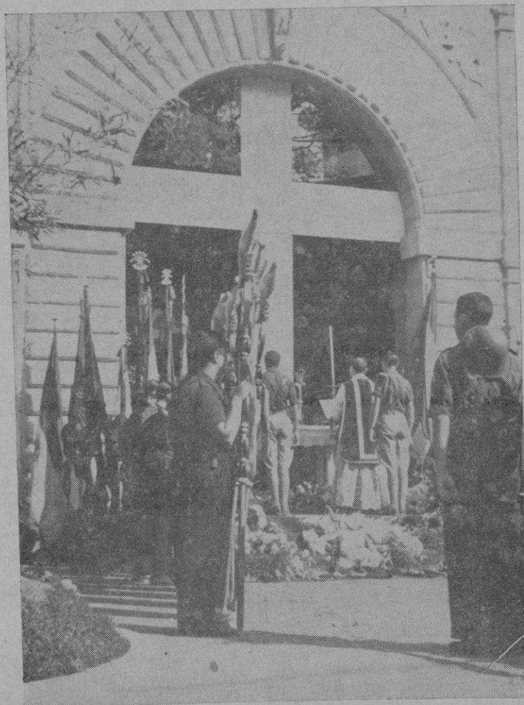
El Altar de los Caídos